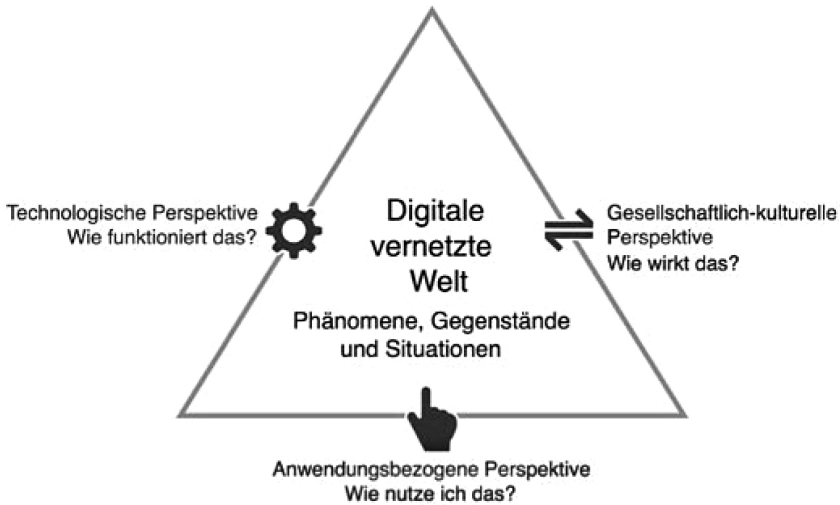
Abbildung 1: Die drei Dimensionen der digitalen Kompetenzen (vgl. GesInf 2017)

nung definiert, dass Kernkompetenzen der Pflegeinformatik sowie informationstechnische Grundbildung in der grundständigen Pflegeausbildung unbedingt zu berücksichtigen sind. Curricula für die Ausbildung der Pflegekräfte müssen demnach auch ein mehrdimensionales Verständnis von Medienkompetenzvermittlung enthalten (siehe Abb. 1, GesInf 2017).