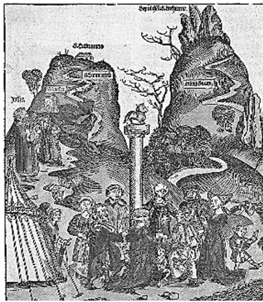
Abb. 3: Biblisches Götzenbild des Goldenen Kalbes in Hartmann Schedels Weltchronik (Nürnberg 1493) 136

Absolutismus und mit einem Höhepunkt in der Französischen Revolution . „Le bonheur est une idée neuve en Europe!“ bekräftigt Saint-Just, der junge Revolutionär und Freund Robespierres, in einer Rede vor dem Konvent 1794: „Europa soll erfahren, dass ihr auf französischem Territorium weder einen Unglücklichen noch einen Unterdrücker mehr sehen wollt, dass dieses Beispiel auf der Erde Früchte trage und die Liebe zur Tugend und das Glück ausbreite! Das Glück ist ein neuer Gedanke in Europa!“ Das allgemeine Glück wird im ersten Entwurf zur französischen Verfassung von 1793 zum ersten Ziel der Gesellschaft: „Le but de la société est le bonheur commun“. Sie trat jedoch nie in Kraft, die blutige Terrorherrschaft des Comité de Salut Public , des Wohlfahrtsausschusses , kam ihr zuvor und übernahm tatkräftig die Sorge für die „öffentliche Wohlfahrt“.