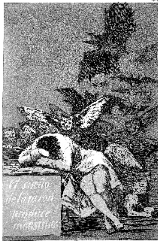
Abb. 2: Francisco de Goya: El sueño de la razón produce monstruos (Der Schlaf [Traum] der Vernunft gebiert Ungeheuer), um 1797–99, Capricho Nr. 43, Radierung, Madrid 32

Nach Jürgen Habermas hat gerade die erkenntnistheoretische Orientierung der neuzeitlichen Philosophie zur szientistischen Sichtweise beigetragen, dass „Wissenschaft nicht länger als eine Form möglicher Erkenntnis“ gilt, sondern es zu der Identifikation von „Erkenntnis mit Wissenschaft“ 33 kommt. Nur den als naturwissenschaftlich-objektiv verstandenen primären Qualitäten der Gegenstände im Sinne Galileo Galileis kommt objektive Realität zu, alle Wahrnehmungen und Empfindungen liegen als sekundäre Qualitäten allein im Subjekt. 34 Die Realität verengt sich auf das methodisch Nachweisbare, das streng genommen nur das Messbare ist. Daher das heute alle Forschung bestimmende und genau zutreffende – wiewohl fiktive – Zitat Galileis: „Wer naturwissenschaftliche Fragen ohne Hilfe der Mathematik lösen will, unternimmt Undurchführbares. Man muss messen, was messbar ist, messbar machen, was es nicht ist.“ 35 Wie Max Horkheimer in seiner grundlegenden Abhandlung über die instrumentelle