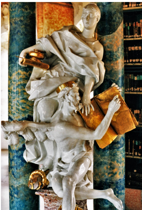
Klosterbibliothek Wiblingen, Statuen vor den Doppelsäulen (1745): Geschichtswissenschaften; von Dominikus Hermenegild Herberger (1694–1760)

Das an den Anfang von „Gedächtnis, Geschichte, Vergessen“ gestellte Foto aus der barocken Bibliothek des ehemaligen Benediktinerklosters Wiblingen in der Nähe von Ulm trägt eine handschriftliche Unterschrift von Paul Ricoeur: „Entre la Déchirure par le Temps ailé et l’Écriture de l’histoire et son stylet“ – „Zwischen dem ZERREISSEN durch die geflügelte Zeit und dem SCHREIBEN der Geschichte und ihrem Griffel“. Ricoeur interpretiert diese Figur: „Es handelt sich um die Doppelgestalt der Geschichte. Vorne der geflügelte Gott Chronos. Ein alter Mann, die Stirn von einem golde-