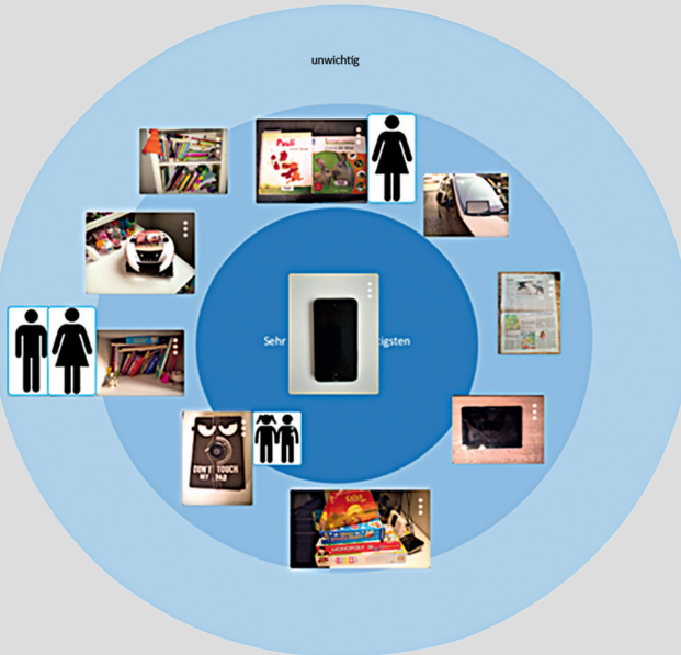
Abbildung 7: Medienrepertoire von Sophie in Erhebungswelle 1