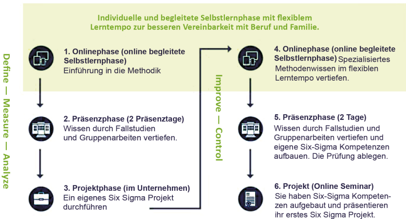
Abbildung 2: Exemplarische vereinfachte Aufbaudarstellung des hybriden Weiterbildungsformats für den Six Sigma Green Belt (Quelle: Homepage der Akademie der Ruhr-Universität).