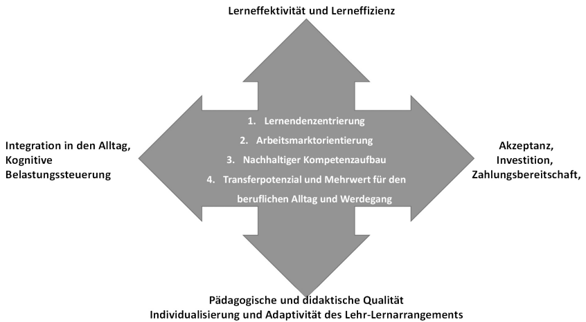
Abbildung 1: Orientierungsdimensionen und Kriterien für die Formatkonzeption.

tigkeit in Bezug auf langanhaltende Beherrschung der neuen Kompetenz sowie Nachhaltigkeit im Kontext der möglichst langfristigen Relevanz der vermittelten Kompetenz für das berufliche Umfeld, pädagogische und didaktische Qualität sowie Akzeptanz und Kosten-Nutzenverhältnis bestmöglich miteinander zu kombinieren.