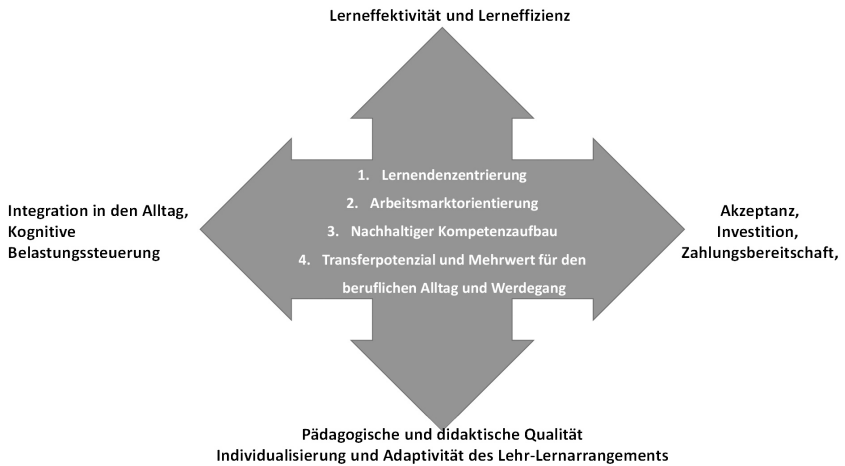
Abbildung 1: Orientierungsdimensionen und Kriterien für die Formatkonzeption.

tigkeit in Bezug auf langanhaltende Beherrschung der neuen Kompetenz sowie Nachhaltigkeit im Kontext der möglichst langfristigen Relevanz der vermittelten Kompetenz für das berufliche Umfeld, pädagogische und didaktische Qualität sowie Akzeptanz und Kosten-Nutzenverhältnis bestmöglich miteinander zu kombinieren.