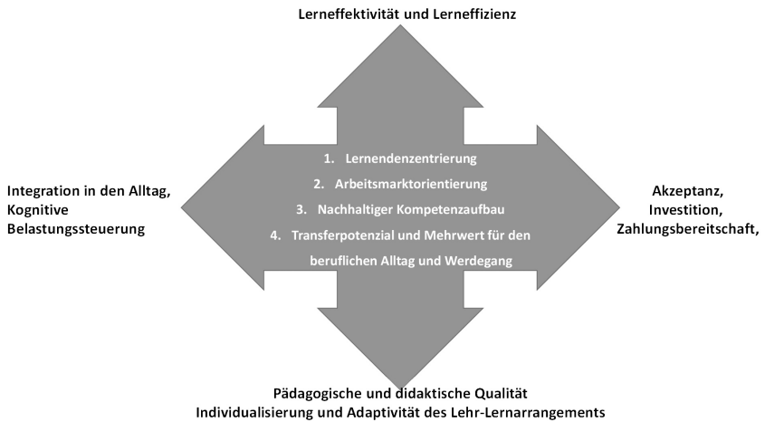
Abbildung 1: Orientierungsdimensionen und Kriterien für die Formatkonzeption.

tigkeit in Bezug auf langanhaltende Beherrschung der neuen Kompetenz sowie Nachhaltigkeit im Kontext der möglichst langfristigen Relevanz der vermittelten Kompetenz für das berufliche Umfeld, pädagogische und didaktische Qualität sowie Akzeptanz und Kosten-Nutzenverhältnis bestmöglich miteinander zu kombinieren.