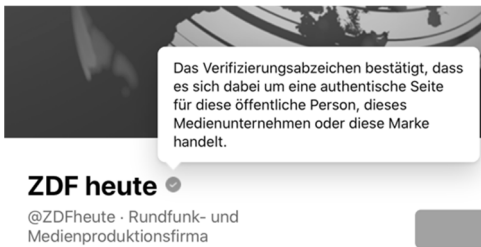
Abb. 2: Hintergrundinformationen zum Verifikationshinweis