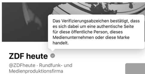
Abb. 2: Hintergrundinformationen zum Verifikationshinweis