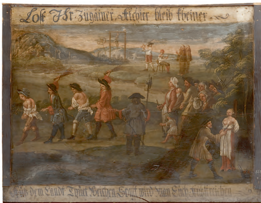
Abb. 1: „Zigeunerverbotstafel“, 17. oder 18. Jahrhundert, Öl auf Holz, 52,2 x 67,5 cm (Universalmuseum Joanneum/Sammlung Volkskundemuseum Graz, Inv. 35.867)

ner, aus dem Land tut weichen, sonst wird man euch austreichen [=auspeitschen]“). 10 Der Text spricht „Zigeuner“ direkt an und ergänzt mit den schriftlichen Aufforderungen und Androhungen die bildliche Darstellung des Strafvollzugs. Gezeigt werden zu jener Zeit übliche Strafen wie Verletzungen durch Brandmarkungen, Auspeitschen, Rädern, Enthauptung und das Erhängen am Galgen.