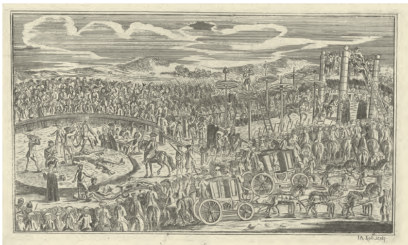
Abb. 2: Johann Andreas Kall, Hinrichtung einer „Zigeunerbande“ , o.J., Kupferstich, aus: Weissenbruch 1727

Kleidung in Form von Hüten und mit zahlreichen Knöpfen bestückten Mänteln, aber auch durch ihre Tätigkeiten – Schreiben, Anweisen oder Patrouillieren – ab.