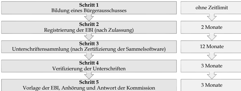
Abbildung 1: Schematische Darstellung des EBI-Verfahrens