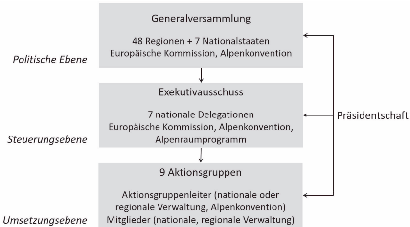
Abbildung 1: Gremien der Alpenraumstrategie

Der vorliegende Beitrag untersucht, inwiefern die Entscheidungs- und Implementationsstrukturen der Alpenraumstrategie den Postulaten demokratischer Legitimität entsprechen. Dabei werden unterschiedliche Demokratiemodelle in den Blick genommen, die territoriale und funktionale Repräsentation sowie direkte, partizipative und deliberative Teilhabe betonen. Die Fallstudie beruht auf einer umfangreichen Dokumentenanalyse, qualitativen Interviews und der teilnehmenden Beobachtung an Treffen und Konferenzen. In einem ersten Schritt wurde eine große Bandbreite von Strategiedokumenten, Positionspapieren, Protokollen und Korrespondenz analysiert, die von beteiligten subnationalen und nationalen Regierungen zur Verfügung gestellt und in einer Internetrecherche identifiziert wurden. In einem zweiten Schritt wurden zwischen Mai 2016 und September 2017 50 Interviews mit Vertretern der subnationalen und nationalen Verwaltungen, europäischer Institutionen, internationaler Organisationen sowie Nichtregierungsorganisationen in Belgien, Deutschland, Frankreich, Italien, der Schweiz, Liechtenstein und Österreich geführt. Zusätzliche Informationen zur Umsetzung demokratischer Normen wurden im Rahmen von Aktionsgruppentreffen und Konferenzen gesammelt. Die Daten wurden mit dem Computerprogramm MAXQDA 12 ausgewertet. Das nächste Kapitel beschäftigt sich zunächst mit der Alpenraumstrategie vor dem Hintergrund repräsentativer Demokratiemodelle.