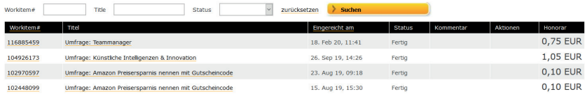
Abbildung 41: clickworker, eigener Screenshot, 27.04.2020.

Fraglich ist, ob es sich dabei um durch die betroffene Person selbst bereitgestellte persönliche Daten handelt. Es ist anerkannt, dass Daten, die eine Konsumhistorie bei einem Online-Händler wiedergeben, als portable Daten iSd. Art. 20 DSGVO angesehen werden. 1420 Da die Daten eindeutig im Profil der registrierten Person hinterlegt sind, sind sie ihr zuzuordnen, so dass es sich um personenbezogene Daten handelt. Sie werden von den Crowd Workern auch bereitgestellt, weil sie ja durch die aktive Bearbeitung von Aufgaben auf der Plattform anfallen. Es ist vergleichbar mit der Konsumhistorie bei Online-Händlern, denn sie wird auch durch den Kauf von Produkten erstellt. Aus Sicht der Verfasserin liegt es nahe, die Arbeitshistorie ebenfalls als portable Daten anzusehen. Das könnte für Crowd Worker auch insofern relevant sein, weil sie wie ein Arbeitszeugnis zeigen, womit sich Crowd Worker beschäftigten und was sie schwerpunktmäßig bearbeitet haben.