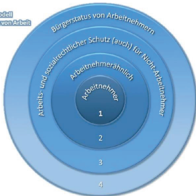
Abbildung 40: Darstellung des 4-Ringe-Modells des sozialen Schutzes von Arbeit nach Mückenberger, Arbeitnehmerbegriff, S. 16.

Ein Vier-Ringe-Modell sozialen Schutzes von Arbeit