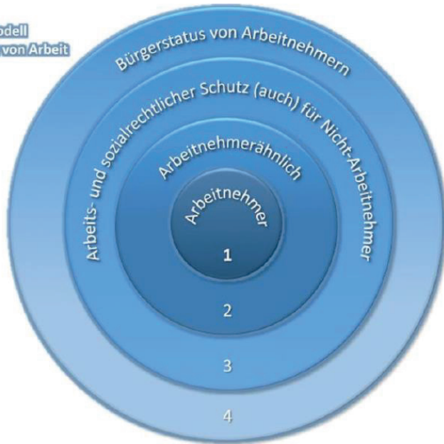
Abbildung 40: Darstellung des 4-Ringe-Modells des sozialen Schutzes von Arbeit nach Mückenberger, Arbeitnehmerbegriff, S. 16.

Ein Vier-Ringe-Modell sozialen Schutzes von Arbeit