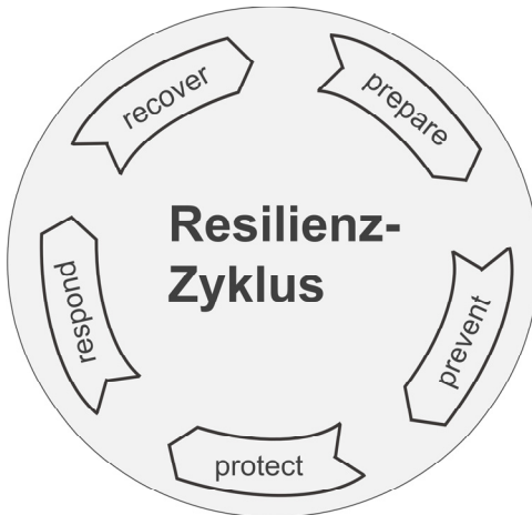
Abbildung 4: Der Resilienz-Zyklus