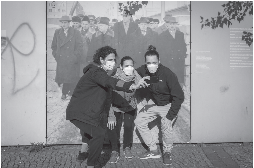
Abb. 3: Schwarz-Weiß-Fotografie aus der Serie „Corona“ von Navid Bookani (2020)

zum mehrschichtigen Bild zusammen. Die Schwarz-Weiß-Ästhetik befördert dabei die Konzentration auf den erfassten inhaltlichen Gedanken, auf Strukturelles im wörtlichen wie im übertragenen Sinn, da es keine Ablenkung durch kontingente Farbphänomene gibt. Die Entwirklichung durch Dekolorierung ist betrachterseitig als Gestus ernsthaften Dokumentierens gelernt, mag Schwarz-Weiß auch kontrafaktisch sein angesichts unserer üblichen Wahrnehmung der Welt als farbiger. Zugleich wird die Entscheidung gegen Farbfotografie inzwischen oft als künstlerische aufgefasst und in Zusammenhang mit der Positionierung als Autorenfotograf*in gesehen.