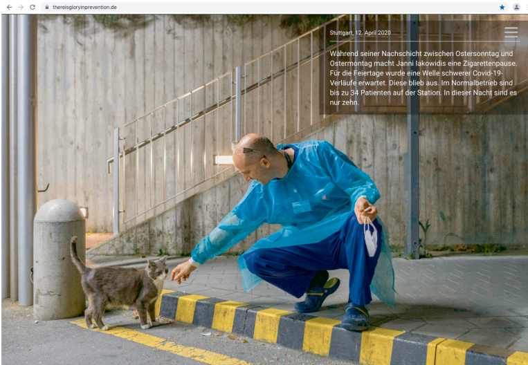
Abb. 5: Pfleger der Covid-19-Station bei der Zigarettenpause, Frühjahr 2020