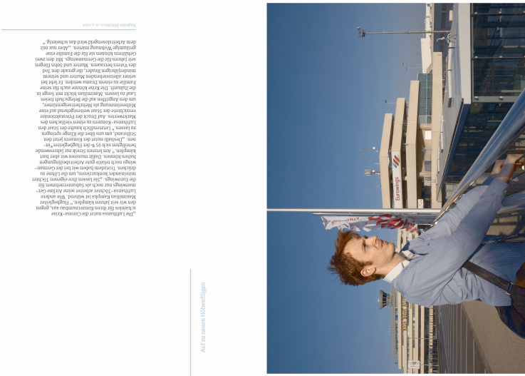
Abb. 4: Doppelseite „Auf zu neuen Höhenflügen“ aus der Publikation „Arbeit in der Krise“