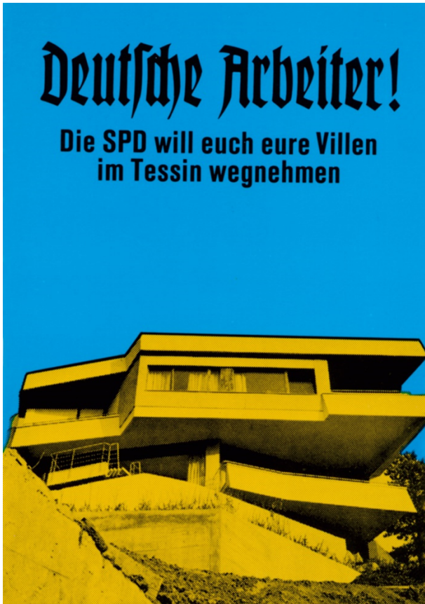
Abb. 2: Klaus Staeck, Deutsche Arbeiter , 1972