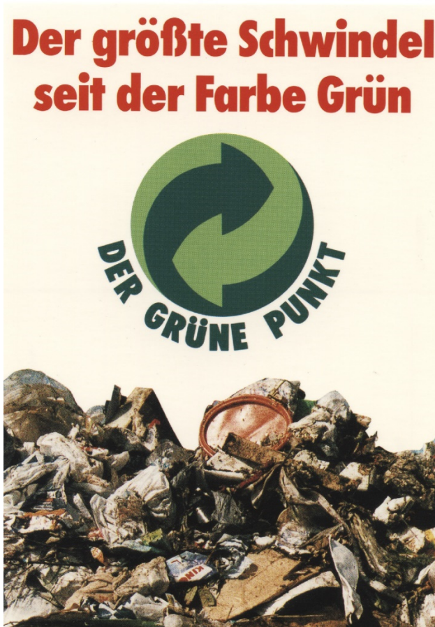
Abb. 11: Klaus Staeck, Grüner Punkt , 1992