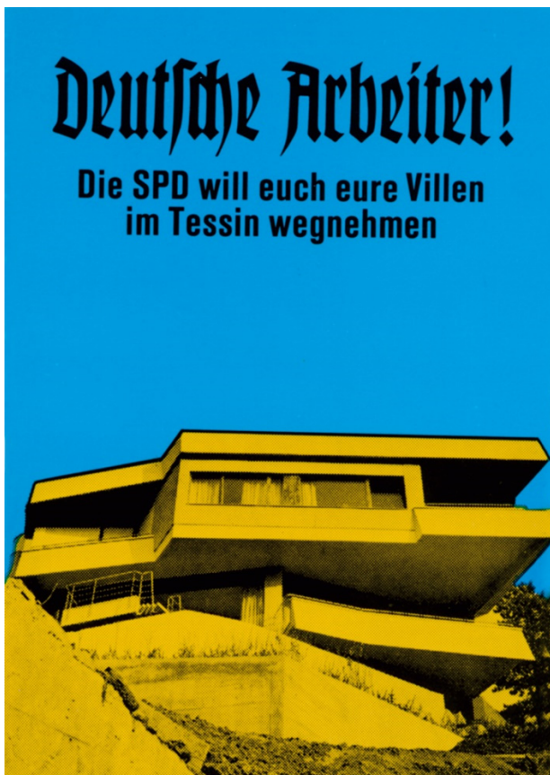
Abb. 2: Klaus Staeck, Deutsche Arbeiter , 1972