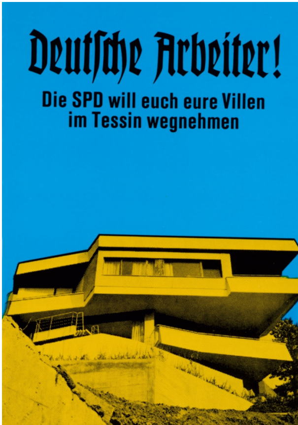
Abb. 2: Klaus Staeck, Deutsche Arbeiter , 1972