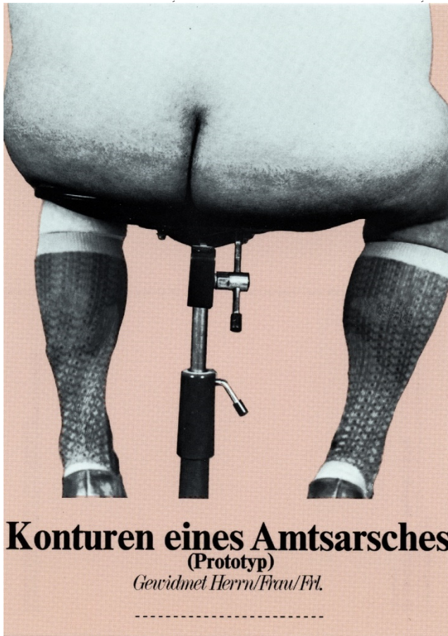
Abb. 7: Klaus Staeck, Amtarsch, 1974