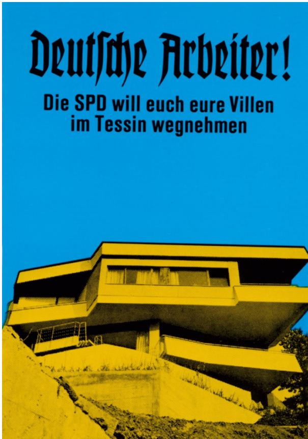
Abb. 2: Klaus Staeck, Deutsche Arbeiter , 1972