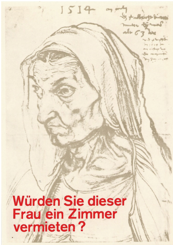
Abb. 1: Klaus Staeck, Sozialfall, 1971