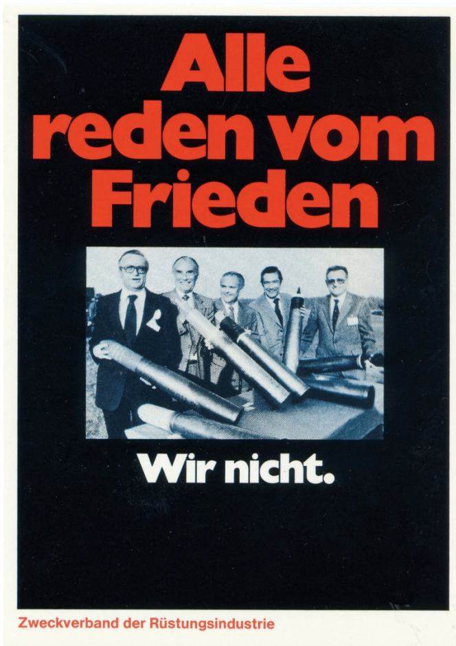
Abb. 8: Klaus Staeck, Alle reden vom Frieden , 1981