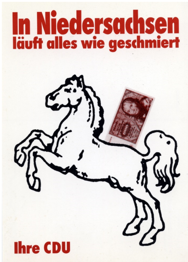
Abb. 5: Klaus Staack, Niedersachsen, 1989