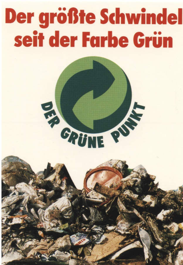
Abb. 11: Klaus Staeck, Grüner Punkt , 1992