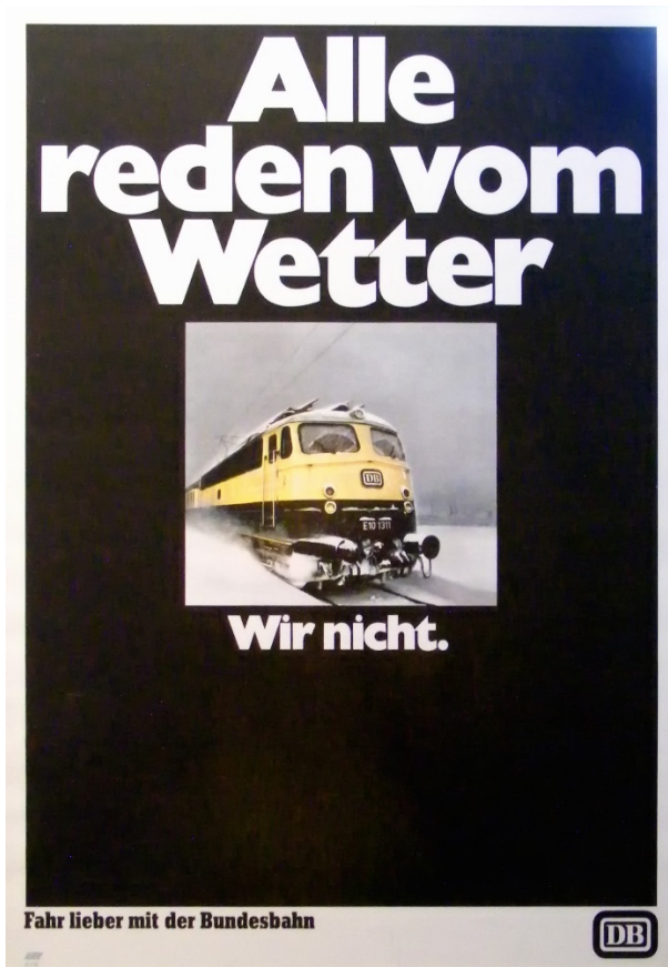
Abb. 09: Bundesbahn, Werbekampagne, 1966