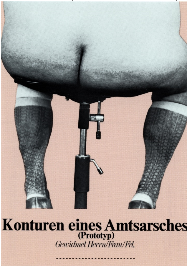
Abb. 7: Klaus Staeck, Amtarsch, 1974