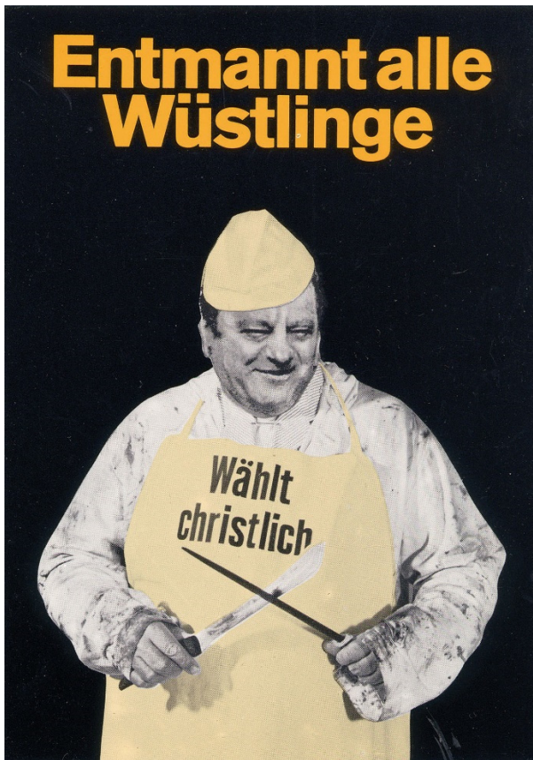
Abb. 3: Klaus Staeck, Entmannt alle Wüstlinge, 1972