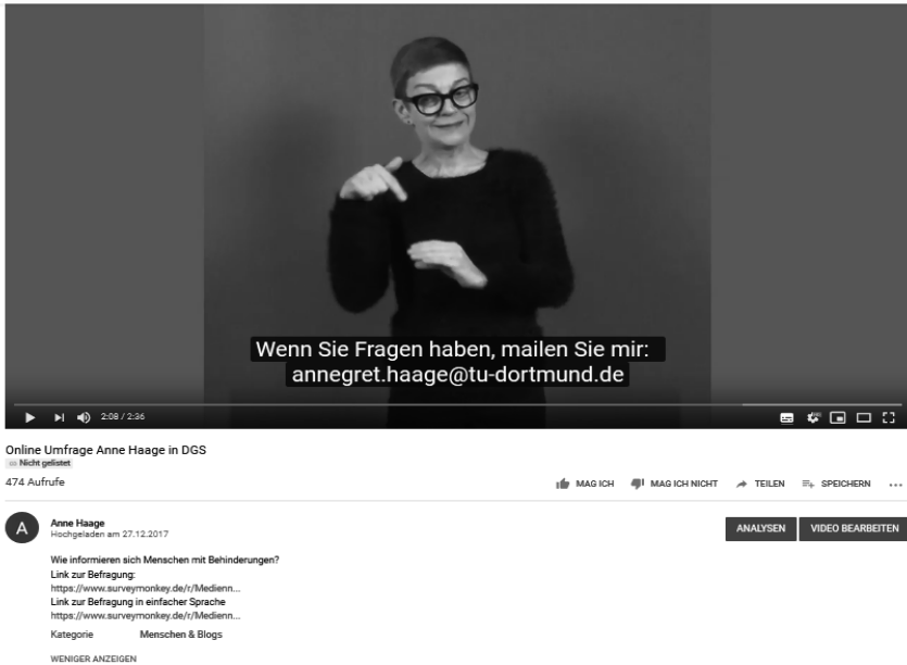
Abb. 9 Screenshot Video zur Umfrage in Deutsche Gebärdensprache

Bei der Auswahl der Plattform für die Online-Befragung standen vor allem drei Gesichtspunkte im Vordergrund: