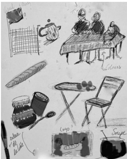
Fig.1: Sketch of the socio-materiality of practice in Solidarity Breakfast (courtesy of Lola Aubry)

Sketching the initiative's everyday enactments of home, with its additions, absences and movement revealed how homing was transformed and compromised with. The recent addition of a bowl of soup to the traditional French breakfast menu was a response to how exiles rapidly became hungry because of a mainly sweet menu imitating traditional breakfast in French homes yet not ideal for migrant newcomers living in the streets and in camps who sometimes only eat once a day. It was also stirred up when attendees disliked the food because of differences in taste and conceptions of homely food. Questions like “Whose home should we enact” and “Do our guests feel at home?” came up regularly and were responded to through socio-material adjustments. In another incidence, knives – after being used for preparation – were removed from the main distribution table in fear that this could lead to harm to self and others, considering the context of exile and deteriorated mental health in the borderlands. Homing was thereby brought back into movement and multiplied, weaved into the borderland, transformed by other conceptions of homeliness forcing shifts in what homing should and could be in that context.