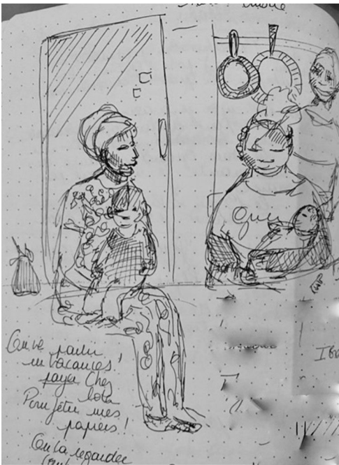
Fig.2: Field Sketch showing attendees in “the Kitchen” caring for each other's kids, braiding each other's hair while chatting about organizing a holiday “once everything is over.”