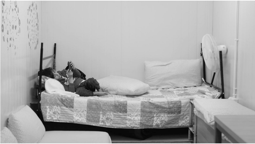
Fig.3. Scene home on the move: a young boy trying to adapt in his temporary shelter "still(s) from the film 13 Square Meters, directed by Kamil Bembnista & Ayham Dalal; courtesy of SFB 1265 Re-Figuration of Spaces."