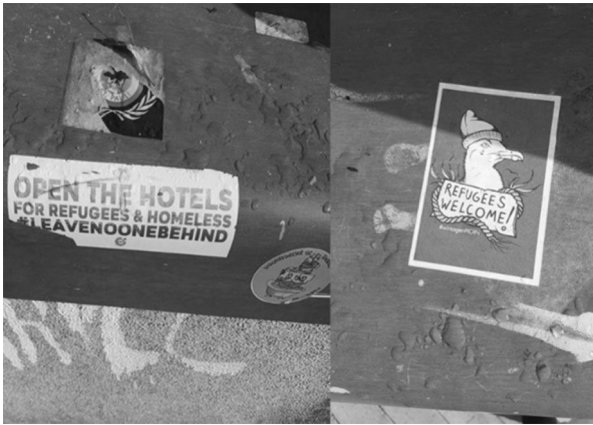
Fig.7. Stickers from one of the places in Flensburg where homeless people usually hang out during the day