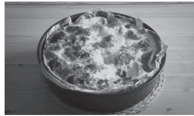
Abbildung 1-4: Italorrains 42:48 – 43:35: Quiche tricolore , Eva Nossem 2024

Selbstverständlich bietet auch die alltagskulturelle Praktik der Zubereitung und des gemeinsamen Konsumierens von Speisen einen reichen Fundus für hybrides Placemaking . In allen Filmen werden Szenen gezeigt, in denen sich die Familie in der Küche oder am Esstisch zusammenfindet, Pasta zubereitet und gemeinsam isst. Als typischer Marker indiziert Pasta bereits Italien; die Praktik der gemeinsamen Pastaherstellung in der Küche ( Italorrains 36:45-28:25) und des gemeinsamen Essens ( Italorrains 4:09) verstärken diese Indexierung weiter. Auch hier wird also eine italienische Praktik in den großregionalen Raum integriert. Das alltagskulturelle Placemaking wird noch verstärkt durch den Sprachgebrauch, denn in den Essensszenen wechseln die Figuren verstärkt ins Italienische. Dieses hybride Placemaking durch die hochkonzentrierte Integration des Italienischen in den großregionalen Raum wird in Italorrains auf die Spitze getrieben: Die Figuren bereiten eine lothringer Quiche zu, allerdings mit einem eigentlich einer Pizza zugeschriebenen Belag aus Brokkoli, Mozzarella und Tomate, dekoriert in den Farben der italienischen Tricolore ( Italorrains 43:26)!