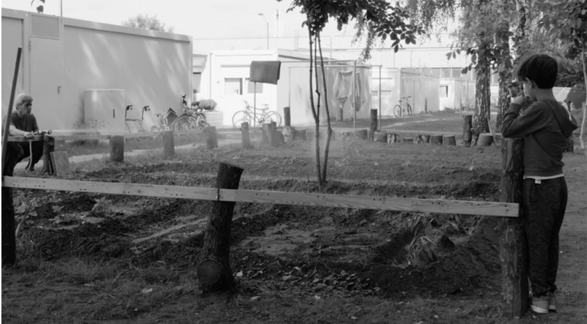
Fig.4. Gardening scene: a metaphorical practice of rooting on the move “still(s) from the film 13 Square Meters, directed by Kamil Bembnista & Ayham Dalal; courtesy of SFB 1265 Re-Figuration of Spaces.”

home. To settle requires the engagement and negotiation with the place and thus adapting to the flux of the borderlands: homing as a dynamic 'dwelling-act'.