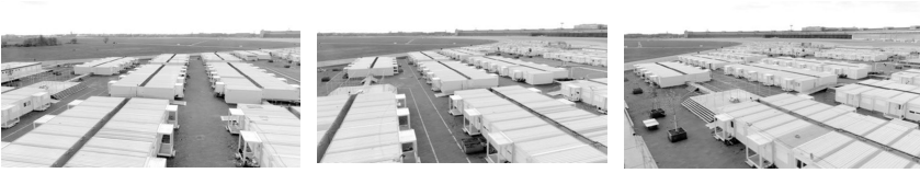
Fig.5. Moving the static: Drone orbits the immovable container homes “still(s) from the film 13 Square Meters, directed by Kamil Bembnista & Ayham Dalal”