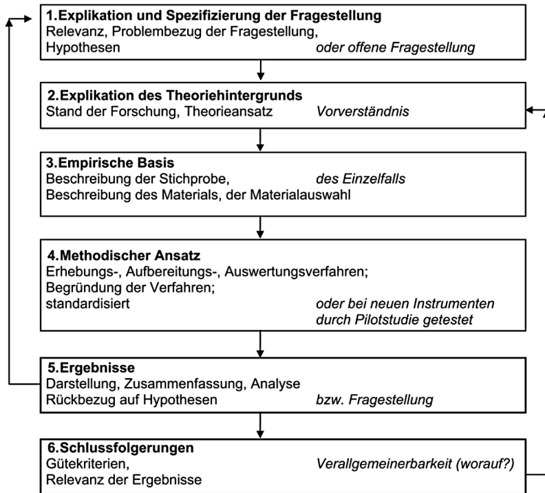
Abbildung 3: Grunddesign qualitativer (und quantitativer) Forschung nach Mayring (2020, 5)

Da jedoch die Auswahl des Studientyps und des Designs die grundsätzliche Herangehensweise definiert, ohne dabei eine konkrete methodische Anwendung vorzuschreiben, sollte auch eine passende Methode für die Einzelfallstudie ausgewählt werden (Mayring 2020, 8). Die Einzelfallanalyse erlaubt es, verschiedene Daten nutzbar zu machen. Es können sowohl standardisierte als auch nichtstandardisierte Daten verwendet werden (Hering & Jungmann 2019, 624). Relevant ist jeweils der Gewinn für das Tiefenverständnis des Falles bzw. das Erkenntnisinteresse; so stellen unter anderem Archivdaten, Dokumente, qualitative Interviews, Statistiken, Umfragen, aber auch Bild- und Tonmaterialien sowie Objekte aller Art mögliche Informationsquellen dar (ebd.). Aufgrund der Tatsache, dass in der vorliegenden Forschung sowohl mit Zeitungsartikeln als auch mit Interviews und anderen Quellen gearbeitet wird, ist die geeignete Methode die qua-