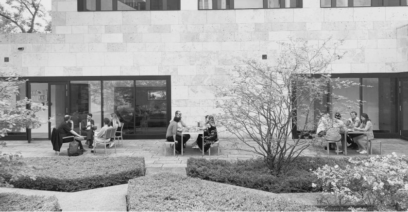
Teilnehmende des Erfahrungsaustausches im Garten des Max-Planck-Instituts für Rechtsgeschichte und Rechtstheorie.