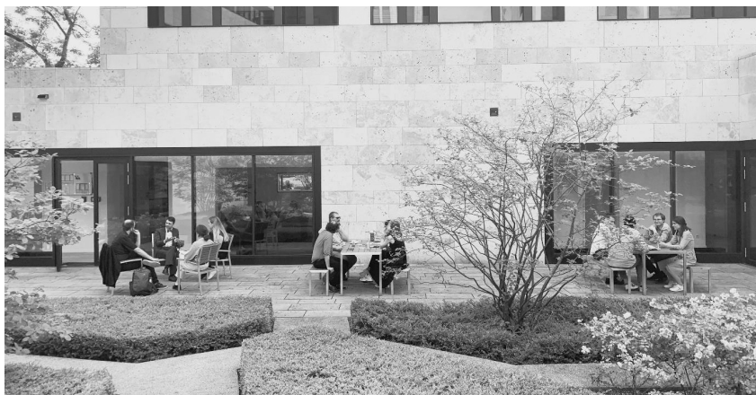
Teilnehmende des Erfahrungsaustausches im Garten des Max-Planck-Instituts für Rechtsgeschichte und Rechtstheorie.