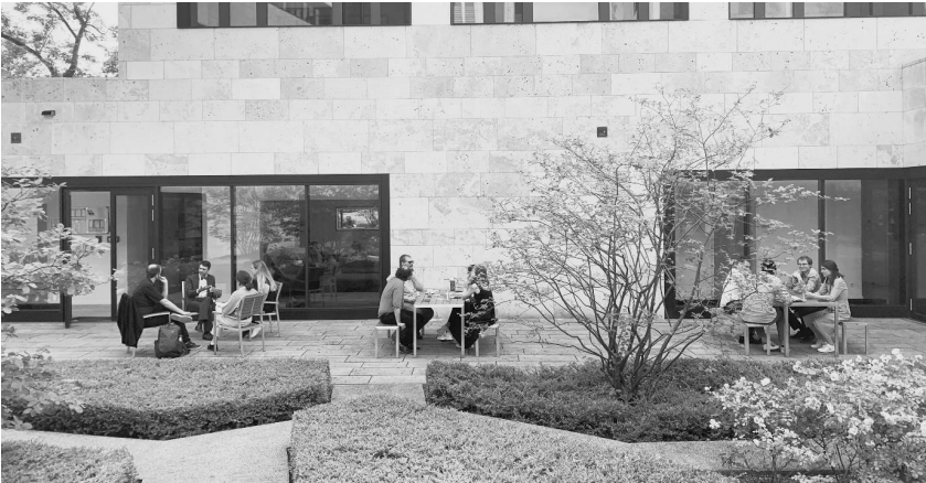
Teilnehmende des Erfahrungsaustausches im Garten des Max-Planck-Instituts für Rechtsgeschichte und Rechtstheorie.