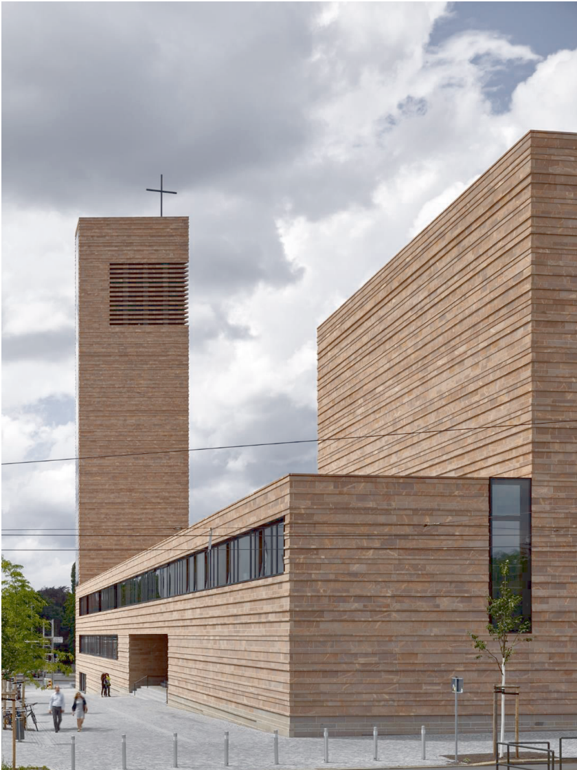
Abbildung 4: Der Kirchenbau ist mit Rochlitzer Porphyrt umhüllt, einem regionalen Naturstein mit großer Tradition.