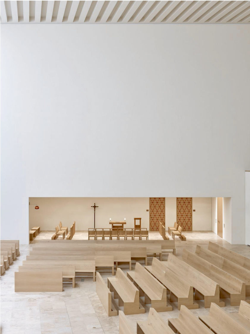
Abbildung 3: Die Werktagkapelle ist räumlich vom Kirchenraum differenziert, kann aber mit diesem verbunden werden.