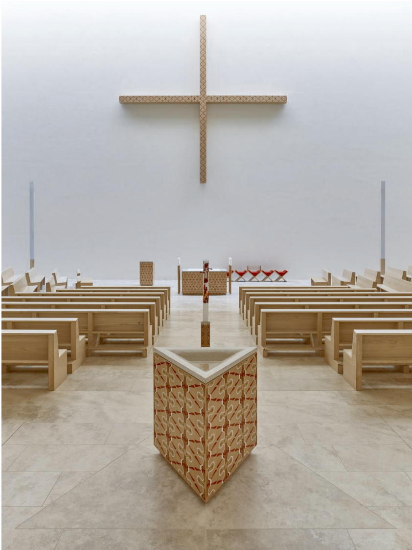
Abbildung 5: Taufstein, Osterleuchter und Altar bilden die liturgische Achse, der Priestersitz ist als Regiestuhl gestaltet.