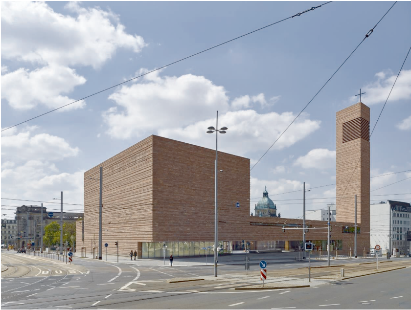
Abbildung 1: Die Form der Leipziger Propsteikirche ist aus dem Städtebau entwickelt: Die Hochpunkte Glockenturm und Kirchenraum betonen wichtige Kreuzungspunkte des Promenadenrings.

ist beispielsweise verbindlich festgelegt, dass der Altar frei stehen soll, damit der Priester ihn umschreiten und sich bei der Eucharistiefeier der Gemeinde zuwenden kann. 21 Viele andere Hinweise sind unbestimmter und lassen oft eine Wahlmöglichkeit zu. So kann zum Beispiel der Taufbrunnen sowohl im Kirchenraum im Blickfeld der Gemeinde als auch in einem separaten Raum aufgestellt werden. 22 Formulierungen wie „normalerweise“, „in der Regel“ oder „es empfiehlt sich“ deuten Spielraum für individuelle Lösungen an, die sich aus den Vorstellungen der Gemeinde und den Wechselwirkungen mit dem architektonischen Raum ergeben könnten.