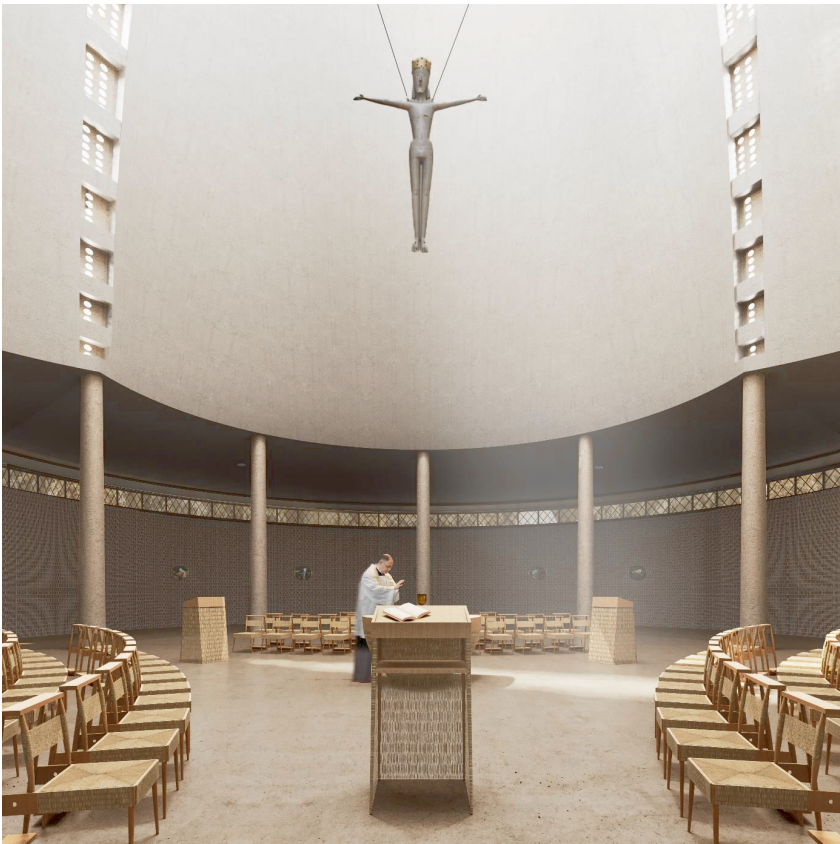
Abbildung 7: Im Innern von St. Rochus korrespondieren richtungsloser Zentralraum und auf die Mitte ausgerichtete Liturgie. (Darstellung: Schulz und Schulz)

Personen den Gottesdienst, zu den übrigen Zeiten dient er dem stillen Gebet oder wird als Attraktion bei Stadtführungen besichtigt. Dieses einfache Anforderungsprofil bietet die Chance, Raum und Liturgie einander anzunähern.