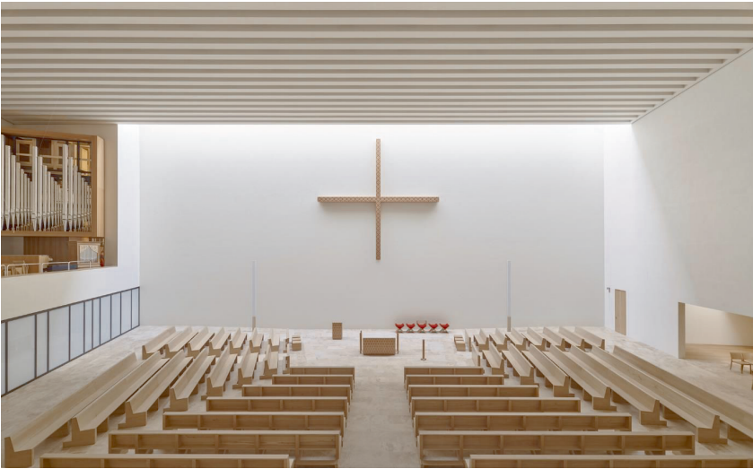
Abbildung 2: Der Innenraum der Propsteikirche ist von der Anordnung der Gemeinde im offenen Circumstantes bestimmt.

geht zurück auf den Architekten Rudolf Schwarz, der für die Entwicklung des Kirchenbaus im 20. Jahrhundert von großer Bedeutung war. 26 Der Wunsch der Gemeinde nach dieser Anordnung schränkt die Proportionen des zu entwerfenden Kirchenraums ein, denn die kreisförmige Anordnung verlangt einen Raum mit annähernd gleicher Tiefe und Breite.