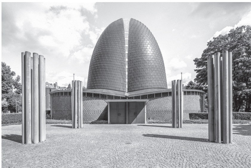
Abbildung 6: St. Rochus in Düsseldorf ist ein einzigartiger sakraler Zentralbau mit einer dreiteiligen, 28 Meter hohen Kuppel.

Vielleicht ist sie zu radikal konzipiert, als dass Architekt und Pfarrer den Mut und die Kraft gehabt hätten, das Projekt gemeinsam zum guten Ende zu bringen. Schneider-Esleben kämpfte – wie zahlreiche Skizzen aus seinem Nachlass zeigen – mit dem entwurflichen Problem, die Zentralität des Raumes mit der Gerichtetheit der vorkonziliaren Liturgie in Einklang zu bringen. Nach seinem Ausscheiden aus dem Projekt beauftragte der Pfarrer Dritte mit der Ausführung einer nach Osten gerichteten Gemeindevorrichtung und vergab die Chance, Raum und Liturgie in Einklang zu bringen. Diversen Umgestaltungen ist es nicht gelungen, eine sich gegenseitig befruchtende Einheit von Raum und Liturgie zu erzeugen.