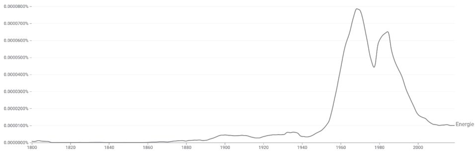
Grafik 1: Verwendungshäufigkeit des Begriffs „Energie“ in der deutschsprachigen Literatur 1800–2020 4