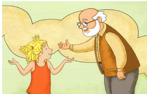
Abb. 81–85: Ältere Männer erklären Kindern Religion, Laube/Zünd: Erklär mir deinen Glauben, S. 11; Brown/ Langley/Gower: Woran wir glauben, S. 8; Vellguth/Witzig: Gemeinsam im Gelobten Land, S. 28f.; Staszewski/Stachuletz/Blumenthal: Mona und der alte Mann, S. 7; Gürz Abay/Demirtaş: Leyla und Linda feiern Ramadan, S. 21.