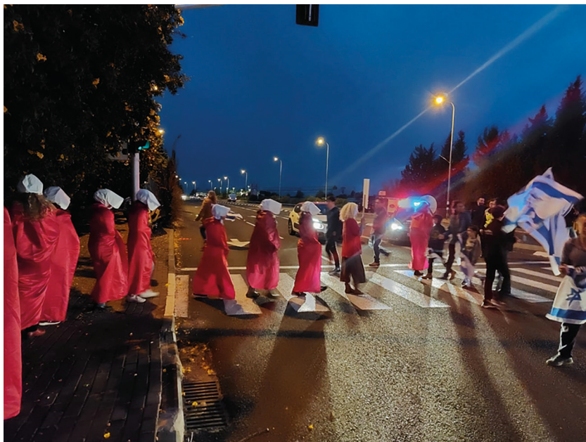
Abbildung 3: Smartphonefoto von als Handmaids verkleideten Frauen, die in Tel Aviv gegen die Regierung von Benjamin Netanjahu protestieren am 18.03.2023.

dass nicht nur die Forschungsgegenstände, sondern auch die Organisation der Wissenschaft und wir als forschende Menschen stetig in Transformationen und Perspektivenwechsel involviert sind.