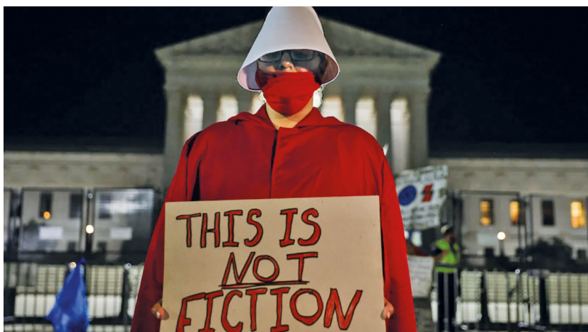
Abbildung 1: Als Handmaid verkleidete Demonstrantin vor dem Supreme Court Building in Washington D.C.

Die in diesem Beispiel beobachtbare Interaktion zwischen Fiktion und Realität zeigt besonders eindrücklich die Komplexität der Wechselwirkungen zwischen Religion, Politik, Gender und Medien und ihre grundlegende Bedeutung in der heutigen pluralen, ausdifferenzierten und mediatisierten Gesellschaft. Die Mägde in den roten Kleidern mit den weißen Hauben sind versklavte, potentielle Leihmütter im theokratischen Staat Gilead. Der fiktive dystopische Staat wurde durch einen Putsch errichtet und versucht mit drastischen Maßnahmen und extremer Gewalt, einer ökologischen und sozialen Katastrophe entgegenzuwirken. Da aufgrund der Umweltzerstörung die menschliche Reproduktion fast unmöglich ist, werden Frauen, die noch fruchtbar sind, gewaltsam gezwungen, den Männern der gileadischen Oberschicht Kinder zu gebären. Jeglicher Autonomie beraubt, werden sie in den Familien der Commanders festgehalten und einmal pro Monat in religiösen Zeremonien vergewaltigt. Gebären sie innerhalb einer bestimmten Frist keine Kinder, werden sie in Lager in den verseuchten Kolonien gesteckt, wo sie als wertlose Arbeitskräfte bis zum Erschöpfungstod ausgebeutet werden.