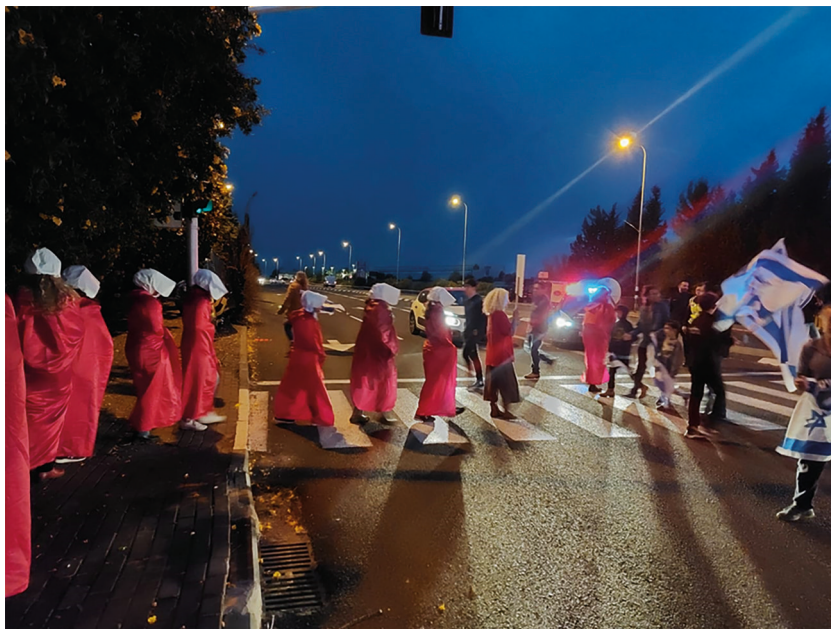
Abbildung 3: Smartphonefoto von als Handmaids verkleideten Frauen, die in Tel Aviv gegen die Regierung von Benjamin Netanjahu protestieren am 18.03.2023.

dass nicht nur die Forschungsgegenstände, sondern auch die Organisation der Wissenschaft und wir als forschende Menschen stetig in Transformationen und Perspektivenwechsel involviert sind.