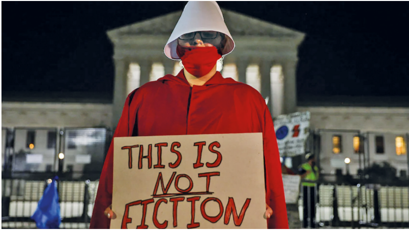
Abbildung 1: Als Handmaid verkleidete Demonstrantin vor dem Supreme Court Building in Washington D.C.

Die in diesem Beispiel beobachtbare Interaktion zwischen Fiktion und Realität zeigt besonders eindrücklich die Komplexität der Wechselwirkungen zwischen Religion, Politik, Gender und Medien und ihre grundlegende Bedeutung in der heutigen pluralen, ausdifferenzierten und mediatisierten Gesellschaft. Die Mägde in den roten Kleidern mit den weißen Hauben sind versklavte, potentielle Leihmütter im theokratischen Staat Gilead. Der fiktive dystopische Staat wurde durch einen Putsch errichtet und versucht mit drastischen Maßnahmen und extremer Gewalt, einer ökologischen und sozialen Katastrophe entgegenzuwirken. Da aufgrund der Umweltzerstörung die menschliche Reproduktion fast unmöglich ist, werden Frauen, die noch fruchtbar sind, gewaltsam gezwungen, den Männern der gileadischen Oberschicht Kinder zu gebären. Jeglicher Autonomie beraubt, werden sie in den Familien der Commanders festgehalten und einmal pro Monat in religiösen Zeremonien vergewaltigt. Gebären sie innerhalb einer bestimmten Frist keine Kinder, werden sie in Lager in den verseuchten Kolonien gesteckt, wo sie als wertlose Arbeitskräfte bis zum Erschöpfungstod ausgebeutet werden.