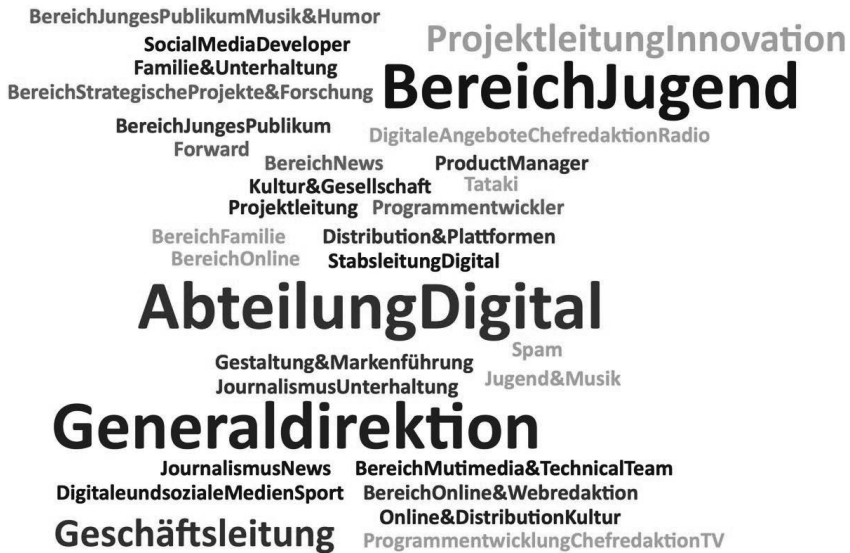
Abbildung basiert auf eigenen Daten

Sämtliche Interviews wurden nach Einwilligung der Expert:innen als Audio aufgezeichnet, um diese im Anschluss transkribieren zu können. In den Gesprächen waren in der Regel zwei Interviewer:innen aus dem Forschungsteam anwesend, die als gleichberechtigte Gesprächsteilnehmer:innen am Interview teilnahmen und mit denen die jeweiligen Expert:innen Wissen und Informationen austauschten (Bogner et al., 2014). Während die ersten Interviews im Jahr 2019 vor Ort bspw. bei SRF in Zürich durchgeführt werden konnten, wurde die Mehrheit der Interviews ab März 2020 aufgrund der COVID-19-Pandemie via Videokonferenztools geführt. Dies erleichterte einerseits den Zugang zu Expert:innen, da beispielsweise Anreisewege wegfielen, führte auf der anderen Seite aber dazu, dass die Interviews nicht im gewohnten Arbeitsumfeld der Expert:innen stattfinden konnte und so auch für das Forschungsteam der Einblick in dieses Umfeld wegfiel.