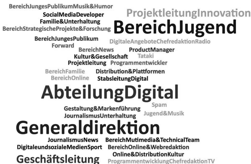
Abbildung 11 Arbeitsbereiche und Positionen der Expert:innen