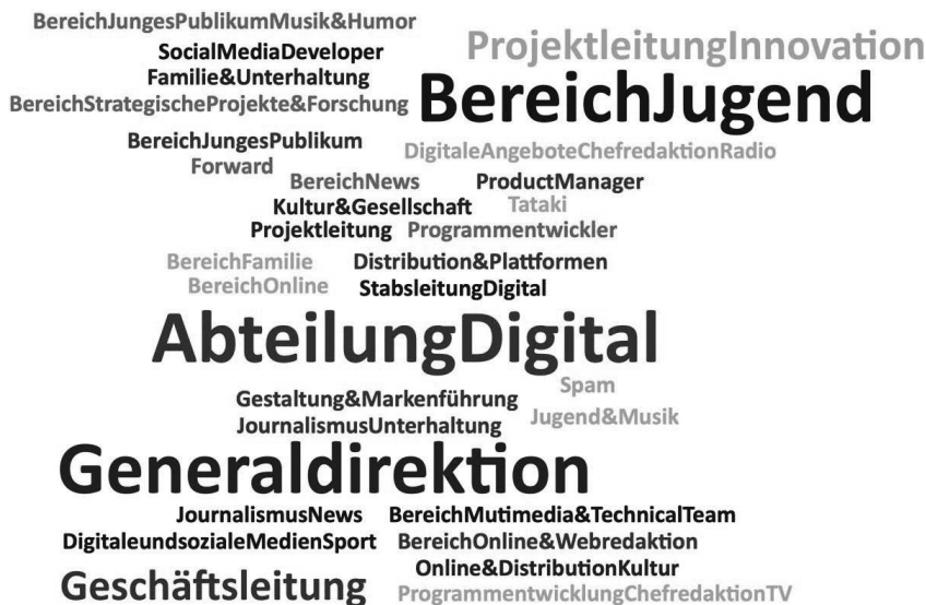
Abbildung 11 Arbeitsbereiche und Positionen der Expert:innen