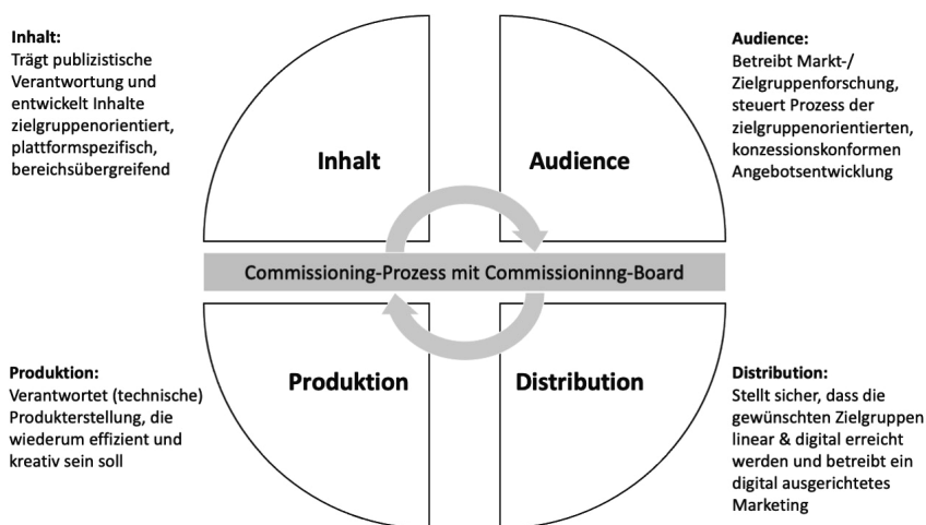
Abbildung 36 Betriebsmodell «SRF 2024»

Eigene Darstellung auf Grundlage von SRG Aargau Solothurn (2022)