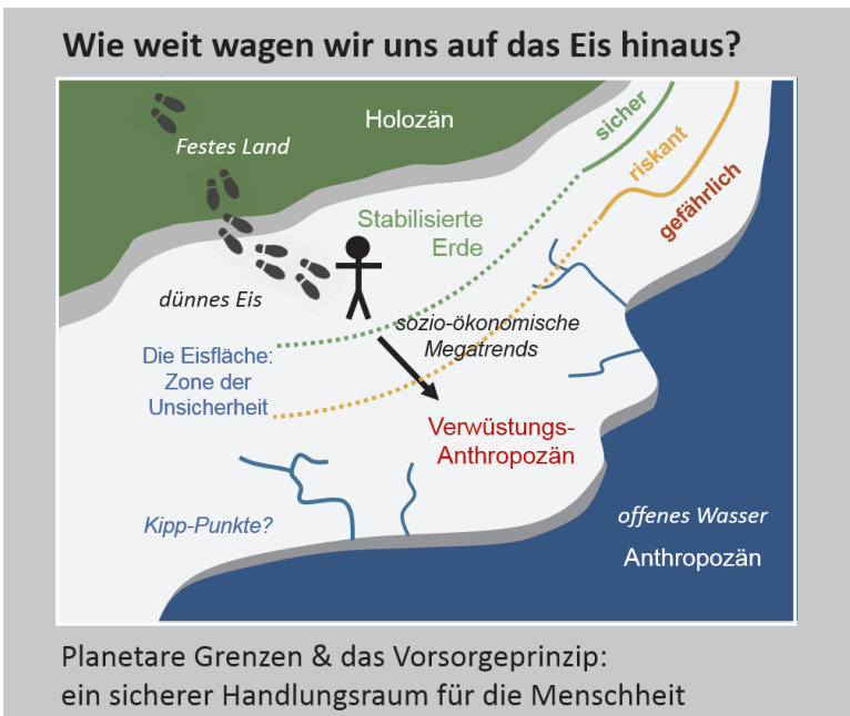
Abbildung 2: Planetare Grenzen und Vorsorgeprinzip

Damit der Zustand der Erde erneut stabilisiert und somit das Risiko für ein Verwüstungsanthropozän gesenkt wird, müssen die sozio-ökonomischen Megatrends bzw. der gesellschaftliche Stoffwechsel insgesamt so kontrolliert werden, dass sie gewisse Grenzen einhalten. Eine Governance der Stoff- und Energieströme sollte also genau dies im Blick haben: den absoluten Druck auf die Erdsystemfunktionen zu reduzieren. Der Zustand der Erde würde ein neues planetares Gemeingut begründen, dessen Erhalt ein System der ausgehandelten Verpflichtungen auch im Bereich nationaler Souveränität nach sich zieht. Damit wäre auch dem Vorsorgeprinzip Rechnung getragen. Um geeignete Schwellenwerte für globale Umweltveränderungen dafür zugrunde zu legen, eignet sich das Konzept der planetaren Belastungsgrenzen 39 . Für neun Dimensionen des Erdsystems grenzt das Konzept einen quantitativ bestimmten „sicheren Handlungsraum für die