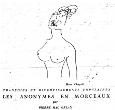
Abbildung 17: Les anonymes en morceaux. Quelle: Mac Orlan 1928

ner Ästhetik des Anonymen zentral ist, nicht darum, Kunst zu schaffen. Er lässt seine Bilder nicht in Galerien ausstellen und publiziert in keiner Fotografie-Zeitschrift, 167 er sieht sich vielmehr als ein Archivar, der seine Bilder wiederum den Künstlern zur Verfügung stellen will. Was er intendiert, ist, Material für Künstler bereitzustellen, die dieses für ihre Zwecke gebrauchen können. Auf dem Schild, das zu seinem Atelier weist, steht »documents pour artistes«. 168 Als Man Ray seine Arbeit entdeckt und zur Kunst erklären will, soll ihm Atget geantwortet haben: »Es sind doch nur Dokumente«. 169 Ähnlich wie Hills ursprüngliche Intention des Riesengemäldes, soll für Atget die Fotografie zunächst die Evidenz liefern, die dann erst als Basis einer künstlerischen Formung dient; wie bei Hill und Adamson Praktiken verselbständigt sich die Evidenz zu einer eigenen Form des Sichtbaren. Durch seine Weise des Sehens und Fotografierens hat er nicht nur die surrealistische Bewegung wesentlich beeinflusst, sondern auch das hervorgebracht, was »dokumentarischer Stil« heißen wird: Die dokumentarischen Fotografien, im Gegensatz zur Pressefotografie oder zu Fotografien des »Muckraking«- Journalismus, dienen nicht bloß der unmittelbaren Darstellung partikularer Tatsachen, sondern sie erscheinen als Dokumente umfassender gesellschaftlicher Realität, die sich ihnen abschattiert. 170