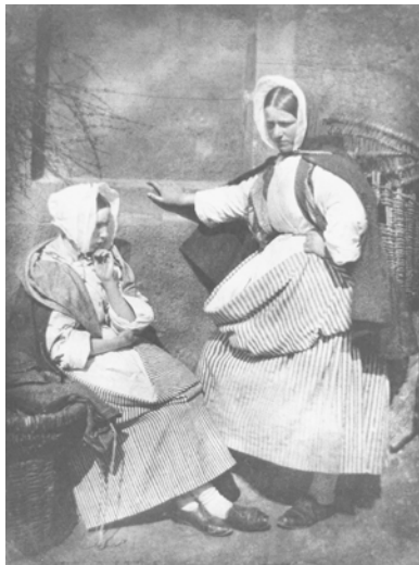
Abbildung 15: Hill und Adamson: Newhaven Fishwives ca. 1845.

hinaus, in dem Sinne, dass das Reale in der Form nicht ganz aufgeht; Reales und Geformtes sind durch einen technisch indizierten Zusammenhang miteinander verbunden. Mehr noch, das nicht zu bändigende Drängen eines Realen im Geformten ist gerade dasjenige, das die Fotografie (eines Menschen) vom Bild (eines Menschen) überhaupt erst unterscheidet; es ist ein Drängen, das die Idee des Idealtypus als Abstraktionsleistung, als Wirklichkeitsferne nicht kennt, mit der die Phänomenologie Schütz' und Natansons arbeitet und die wohl problemlos vom wiedererkannten Typus der Fischfrau ausgegangen wäre. Doch weshalb erzeugt diese Fotografie