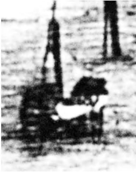
Abbildung 12: Vermeintlich abgelichtete Menschen auf Daguerres Fotografie des Boulevard du Temple 1838.

mensongère, tandis que la photographie est toujours véridique et probante». 34 Die anonyme Fotografie vermöchte sogar das anonyme denunzatorische Schreiben zu ersetzen, mit dem Unterschied, dass eine Denunziation falsch sein könnte, während die Fotografie sich untrüglich gäbe.