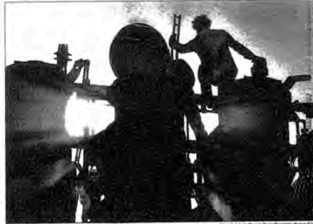
"Steel Plant, France" (1987) by Salgado—A remarkably old-fashioned exterior and a belief in the goodness of humanity

In the catalogue Salgado, 40 calls this person "a teenage son of workers, a farmer in a world of manual labor that is slowly disappearing." Manual labor here means everything from sugar cane harvesting to light making, steel and heavy manufacturing, shipbuilding and shipbuilding, nothing and