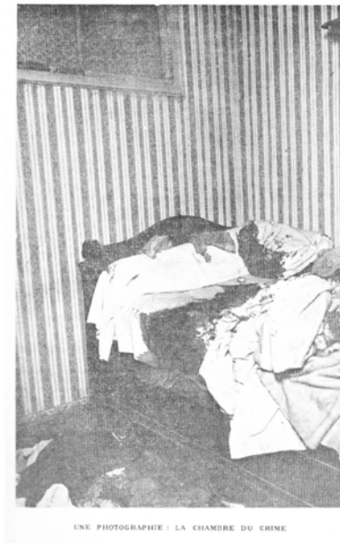
Abbildung 16: Une photographie: La chambre du crime.

Diktum, »dans la Photographie, je ne puis jamais nier que la chose a été là«, 157 erhält hier eine neue Bedeutung: Denn das, was geschehen ist, ist in der Tatortfotografie nicht da, obwohl es das, was »da« ist, die Blutflecken beispielsweise, erst erzeugt hat. Dieser Umstand weist dem Bild eine Unruhe zu, gerade indem es so unwirklich ist, ein vulgäres schreckliches Geschehen ausblendet und zugleich darauf verweist. 158 Die Fotografie, exemplarisch die Tatortfotografie, geht hier einher mit dem Moment einer existentiellen Beunruhigung, 159 da die Sichtbarkeit auf eine andere abwesende Existenz hinweist, ihr sogar ein Mysterium verleiht. Die abwesenden Namenlosen, die unbekanntes Täter, erhalten in diesem Bild eine unheimliche Präsenz, so Mac Orlan. Aber das imaginäre Soziale, das die Unordnung hat erscheinen lassen, lässt sich wiederum nur erahnen.