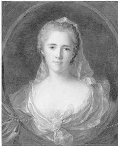
Abbildung 13: Jean-Marc Nattier, Portrait d'une inconnue , 1749.

von Initialen, und »tout Paris« wusste, um wen es sich handelte. 80 Wenn ein Porträt explizit eine unbekannte Person zeigte, wie im Portrait d'une inconnue von Jean-Marc Nattier (1749), ließen dabei die dargestellten Insignien zumindest die soziale Position über eine »esthétique du rang« deutlich hervortreten. 81 Gleichzeitig wurden die Personen explizit als »Unbekannte« markiert, sei es seitens des Malers, Auftraggebers oder Galeristen, aus welchem Grund auch immer. Doch die Exklusivität der Bilder als