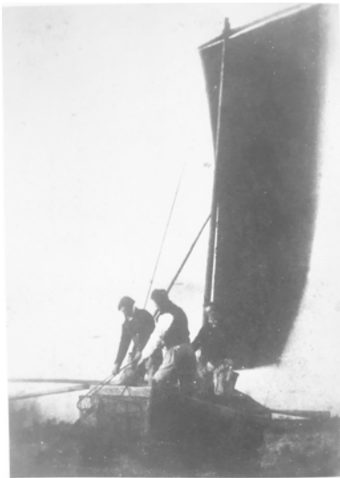
Abbildung 14: Hill und Adamson: »Oyster Dredging«, 1840.

eines Malers. Doch auch erzählerisch war die Umgebung bereits imaginativ aufgeladen, hin zu einem »iconic image« der ursprünglichen Gemeinschaft. So erwähnt Stevenson in ihrer Geschichte dieser Fotografien insbesondere Walter Scotts Roman The Antiquary , der das ebenso tragische und heroische Leben einer Fischersfamilie schildert. 119 Um das einfache Leben dieser Menschen, das stoische Abmühen an der garstigen Existenz angesichts des Ringens mit einem rauhen Meer zu vergegenwärtigen, griffen auch Hill und Adamson zum Mittel der Heroisierung, indem sie beispielsweise Männer zeigten, die auf hoher See Leben retteten. Der einfache Alltag, wie auf der Fotografie Oyster Dredging , erhielt dadurch etwas Majestätisches. Der Erfolg dieser Fotografien blieb nicht aus, die Fotogra-