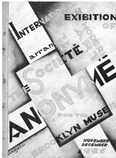
Abbildung 27: The Société Anonyme Inc. Katalog, 1926.

gerichtet. Die Société Anonyme Inc wird von einer Amerikanerin ins Leben gerufen, Katherine Dreier, Immigrantin der zweiten Generation, in Zusammenarbeit mit europäischen Künstlern, darunter Marcel Duchamp oder Man Ray. Das Kollektiv hat zum Ziel, die europäischen Avantgarden des frühen 20. Jahrhunderts nach Amerika zu bringen. 378 Amerika gilt ihnen als Land der Zukunft für die Künste, doch glauben die Initianten, dass es der amerikanischen Kultur an moderner progressiver Kunst mangle, zu materialistisch sei das Land. Von der Kritik noch geschmäht, scheint immerhin ein Publikum zu existieren, das begierig darauf ist, die neue Kunst kennenzulernen. 379 Doch diese Kunst der jüngsten Moderne der Avantgarden hat es in den USA auch deshalb äußerst schwer, weil die Händler und Kunstsammler sich vornehmlich an der klassischen Moderne orientierten und die amerikanische neue Kunst schlicht ignorieren. 380 Die Idee wächst heran, diese Avantgarde-Kunst nicht mehr den üblichen Agenten des künstlerischen Feldes, den kommerziell orientierten Händlern oder den Kunsthistorikern zu überlassen, die Neues mit alten Begriffen »übergießen« und die avantgardistischen Werke alleine aufgrund bestehenden Wissens beschreiben und klassifizieren. 381 Es sollten die Kunstproduzen-