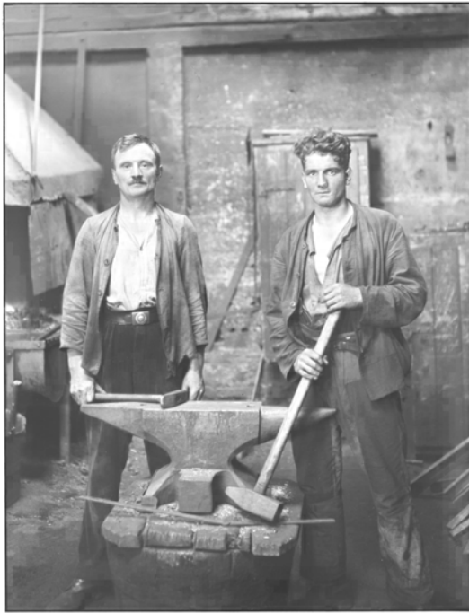
Abbildung 21: August Sander: Grobschmiede (1926).

Szenerie ist gereinigt, sich macht keinen Hehl aus dem künstlich Laborhaften. Letztlich ist paradoxerweise kaum vorstellbar, dass die Schmiede hier Funken sprühen lassen, dass der Ofen glüht, Dampf aufquillt. Dennoch ließe sich schwerlich ein imaginäres Soziales in Sinne Mac Orlands erkennen. Selbst eine lange Betrachtung zeigt kein Detail, das sich der Anordnung sperrt, das weiter weist als dass hier Grobschmiede dargestellt sind. Hier geht die Fotografie aufgrund ihrer klinischen Sachlichkeit beinahe über in ein grafisches Symbol. 256