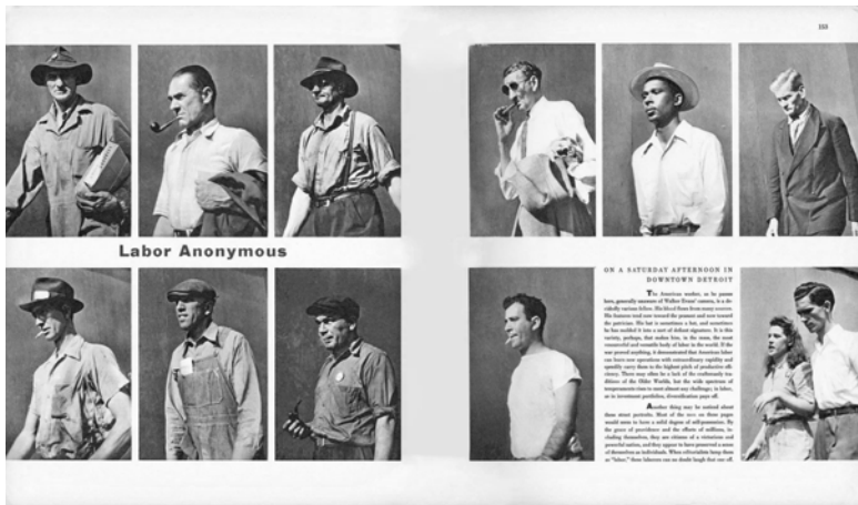
Abbildung 25: Walker Evans: Labour Anonymous.

Ganzen evoziert, die »aboutness« eigentlich definiert. Die sichtbar hervortretende Heterogenität lässt das anonyme Kollektiv der amerikanischen Arbeiterschaft erst als ein wahrnehmbar Ganzes hervortreten. Mit anderen Worten gesagt, liegt hier eine komplexe Operation vor, die weder ausschließlich diskursiv noch visuell genannt werden kann. Die Fotografie als Evidenz verbindet sich mit dem Text zu einer Aussage im umfassenderen Sinne, die Anonymität mit dem Schlüsselterm der Arbeit verbindet. Doch gleichzeitig entsteht die wahrnehmbare Vielfalt gerade dadurch,