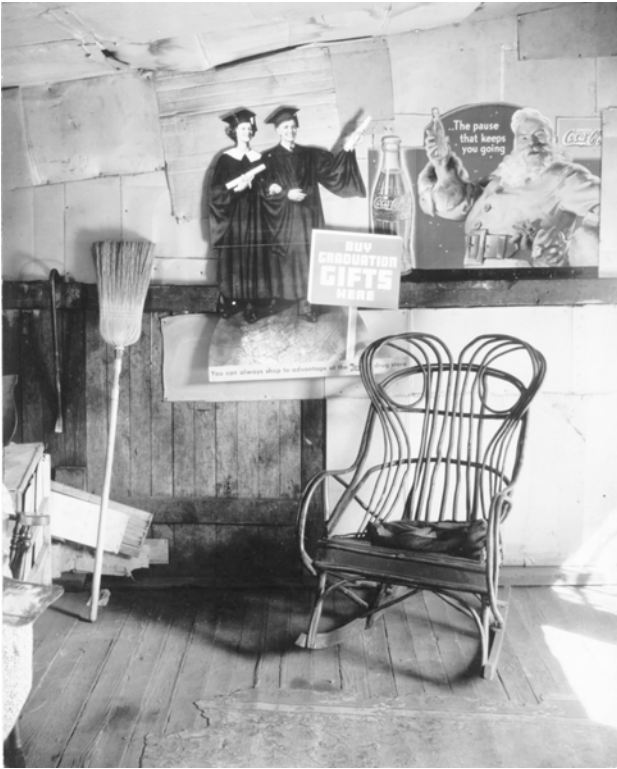
Abbildung 23: Walker Evans: Interior Detail, West Virginia Coal Miner's House. Quelle: Evans 1938, S. 51.

sind nicht standardisiert porträtiert, obwohl es einige wenige solcher Porträts auch gibt. Der Kontrast dieser Darstellungsweise zu den Fotografien von Sander und Hine, bei denen die Individuen meist frontal in die Kamera blicken, könnte nicht größer sein. Zudem zeichnet sich etwas ab, was bei Atgens technisch noch nicht möglich war, nämlich dass Menschen in einem flüchtigen Moment auftauchen, der unmöglich inszeniert sein kann, womit er bereits das Genre der Street Photography vorwegnimmt.