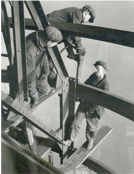
Abbildung 19: Hine: Three Riveters, Empire State Building, 1931.

derem Material verbunden. Nicht ein einzelner Blickpunkt wird als entscheidend und einzigartig etabliert, sondern es werden mehrere Perspektiven erzeugt, die wiederum Lücken hervorbringen, welche die Vorstellungskraft herausfordern oder Raum für ein sozial Imaginäres bieten. Erst die Relation zu anderem, textuellem Material, ergibt überhaupt eine Dokumentation. 235 Diese gezielte Erzeugung einer Assemblage von Material stellt genuines Merkmal der dokumentarischen Methode dar. 236 Sie verhindert einen naiven Objektivismus und sichert die Reflexion über die Realitätserfassung.