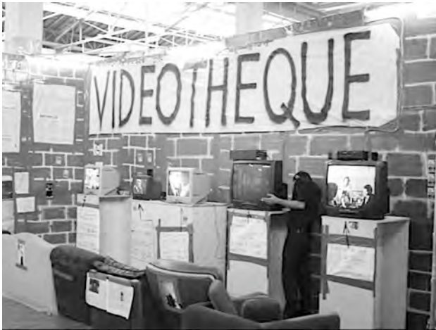
Abbildung 28: Thomas Hirschhorn: 24 heures Foucault. Palais de Tokyo, Paris, 2004.

mer rätselhafter wird, während die epistemische Figur Michel Foucaults permanent an den verschiedensten Orten erscheint: Videos, Zeitungen, Affichen, Exzerpte von Studierenden, Porträtfotografien. Insofern würde der empirische Foucault gerade durch den epischen Gebrauch seines Namens anonymisiert und nicht über dessen bewussten Versuch des Verbergens. Das könnte auch die Botschaft von Hirschhorns Ausstellung sein.