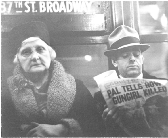
Abbildung 24: Walker Evans: Subway Passengers, 1938. The Metropolitan Museum of Art. 1971.646.18.

Mannes unterstrichen wird. In großen Lettern prangt auf dem Titelblatt der abgelichteten Zeitung »Pal telles how gungirl killed«. Der Mann, der die Zeitung liest, strahlt enorme Gelassenheit aus, als kümmere ihn gar nichts. Die ältere Dame, die neben ihm sitzt, scheint ihn fast ein wenig an den Rand zu drängen, er wirkt geradezu schwächling. Beide neigen sich in demselben Winkel, als ob der Zug gerade in eine Kurve fährt, so ergibt sich eine zusätzliche Aura der Authentizität der Fotografie. Bemerkenswert ist vor allem der Blick der Dame, sie richtet ihn direkt auf den Fotografen, doch er zeugt von außerordentlicher Schläfrigkeit oder vielleicht von Verächtlichkeit. Ist sie sich bewusst, dass sie fotografiert wird? Ist sie eine Beobachterin des Beobachtens oder ist der Blick bloß geistesabwesend? Gerade damit, so ein nicht datierter Text von Agee dazu, werfen diese Fotografien allgemeine Fragen auf: Was wird offenbar und was nicht, was ist gestellt (performed) und was nicht? Was lässt sich interpretieren an den oberflächlichen Zeichen und was bleibt singular und was nicht? Das anonyme Porträt erzeugt ein Rätsel, 335 etwas, woran jede sozialwissenschaftliche Interpretation verzweifeln müsste, nähme sie sich als Wissenschaft ernst.