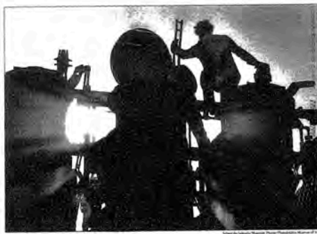
"Steel Plant, France" (1987) by Salgado—A remarkably old-fashioned exterior and a belief in the goodness of humanity

Now "Workers, an Anthology of the Industrial Age" Photography by Sebastião Salgado" is in view at the Philadelphia Museum of Art through July 11, after which it travels to Louisville, Ky., Iowa City, Dallas and, in 1993, New York. This show, 200 pictures large and sponsored by Professional Photographers, a division of the Kaufman-Rohde Company, represents six years of travel to approximately 26 locations and a worldwide work with yet more images. An epic journey of photographs for an epic collection, it ends up being something of an overview. Although many of the pictures are recreational, the photographer is history has taken 200 first and photographs. In the catalogue Salgado, it calls this journey "a message to workers, a tribute to a world of manual labor that is slowly disappearing." Manual labor here means everything from sugar cane harvesting to light making, steel and brick manufacturing, shipbuilding and shipbuilding, clothing and