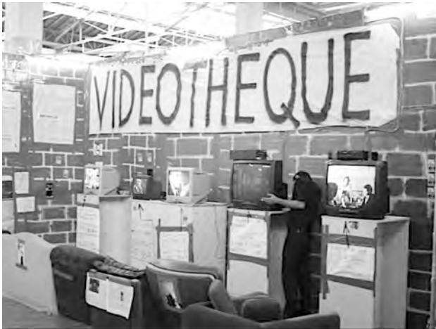
Abbildung 28: Thomas Hirschhorn: 24 heures Foucault. Palais de Tokyo, Paris, 2004.

mer rätselhafter wird, während die epistemische Figur Michel Foucaults permanent an den verschiedensten Orten erscheint: Videos, Zeitungen, Affichen, Exzerpte von Studierenden, Porträtfotografien. Insofern würde der empirische Foucault gerade durch den epischen Gebrauch seines Namens anonymisiert und nicht über dessen bewussten Versuch des Verbergens. Das könnte auch die Botschaft von Hirschhorns Ausstellung sein.