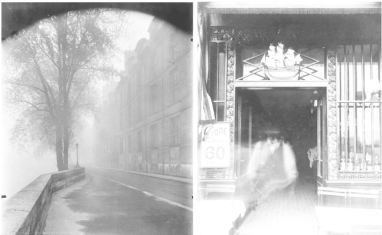
Abbildung 18: Eugène Atget:

entwickeln sollte, dient nicht nur der Abbildung dessen, was vor der Kamera sich unbezweifelbar befunden hat, sie dient nicht nur dem Indexalischen. 184 Sondern sie referiert indirekt darauf, was nicht da ist: die abwesende Industrialisierung und ihre negativen Folgen. Hierin lässt sich auch erkennen, weshalb Mac Orlan sich so sehr für Atget interessiert hat: Indem die Fotografie eben gerade eine Realität zum Erstarren zu bringen vermag, erzeugt sie erst das gesellschaftlich Imaginäre, le Fantastique social . Es handelt sich um einen Vorgang, der eine indexalische Theorie der Fotografie eben gerade nicht erkennen kann. Wohl gerade dadurch erhält die Wirklichkeit, die er zeigt, auch eine gewisse Affinität zum Surrealismus, zu jener Bewegung, die seine Fotografien entdeckt und sie in ihre eigenen »Visions surréalistes« aufgenommen hat. 185 Tatsächlich verweisen seine Fotografien, die einem sachlich nüchternen Blick folgen, immer auch auf eine Wirklichkeit, die nur über das Fotografische erscheint, damit die Technik gleichsam auf ihre technische Form zurückwirft und auf diese Weise auch das gewohnte Sehen surreal verfremdet. Der Mensch, der in