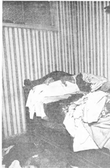
UNE PHOTOGRAPHIE : LA CHAMBRE DU CRIME