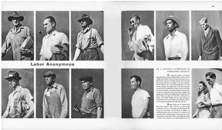
Abbildung 25: Walker Evans: Labour Anonymous. Quelle: Fortune 1946.

Ganzen evoziert, die »aboutness« eigentlich definiert. Die sichtbar hervortretende Heterogenität lässt das anonyme Kollektiv der amerikanischen Arbeiterschaft erst als ein wahrnehmbar Ganzes hervortreten. Mit anderen Worten gesagt, liegt hier eine komplexe Operation vor, die weder ausschließlich diskursiv noch visuell genannt werden kann. Die Fotografie als Evidenz verbindet sich mit dem Text zu einer Aussage im umfassenderen Sinne, die Anonymität mit dem Schlüsselterm der Arbeit verbindet. Doch gleichzeitig entsteht die wahrnehmbare Vielfalt gerade dadurch,