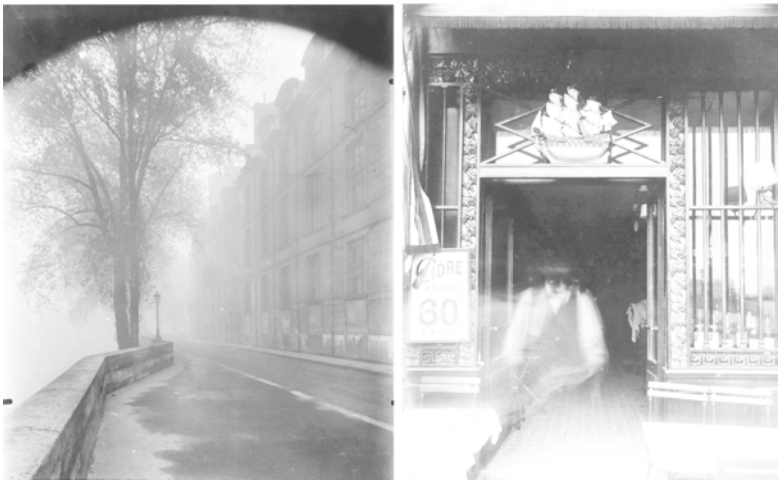
Abbildung 18: Eugène Atget:

entwickeln sollte, dient nicht nur der Abbildung dessen, was vor der Kamera sich unbezweifelbar befunden hat, sie dient nicht nur dem Indexalischen. 184 Sondern sie referiert indirekt darauf, was nicht da ist: die abwesende Industrialisierung und ihre negativen Folgen. Hierin lässt sich auch erkennen, weshalb Mac Orlan sich so sehr für Atget interessiert hat: Indem die Fotografie eben gerade eine Realität zum Erstarren zu bringen vermag, erzeugt sie erst das gesellschaftlich Imaginäre, le Fantastique social . Es handelt sich um einen Vorgang, der eine indexalische Theorie der Fotografie eben gerade nicht erkennen kann. Wohl gerade dadurch erhält die Wirklichkeit, die er zeigt, auch eine gewisse Affinität zum Surrealismus, zu jener Bewegung, die seine Fotografien entdeckt und sie in ihre eigenen »Visions surréalistes« aufgenommen hat. 185 Tatsächlich verweisen seine Fotografien, die einem sachlich nüchternen Blick folgen, immer auch auf eine Wirklichkeit, die nur über das Fotografische erscheint, damit die Technik gleichsam auf ihre technische Form zurückwirft und auf diese Weise auch das gewohnte Sehen surreal verfremdet. Der Mensch, der in