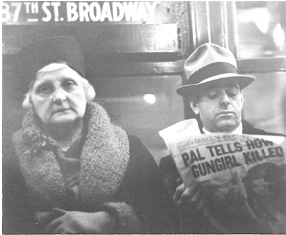
Abbildung 24: Walker Evans: Subway Passengers, 1938. The Metropolitan Museum of Art. 1971.646.18.

Mannes unterstrichen wird. In großen Lettern prangt auf dem Titelblatt der abgelichteten Zeitung »Pal telles how gungirl killed«. Der Mann, der die Zeitung liest, strahlt enorme Gelassenheit aus, als kümmere ihn gar nichts. Die ältere Dame, die neben ihm sitzt, scheint ihn fast ein wenig an den Rand zu drängen, er wirkt geradezu schwächling. Beide neigen sich in demselben Winkel, als ob der Zug gerade in eine Kurve fährt, so ergibt sich eine zusätzliche Aura der Authentizität der Fotografie. Bemerkenswert ist vor allem der Blick der Dame, sie richtet ihn direkt auf den Fotografen, doch er zeugt von außerordentlicher Schläfrigkeit oder vielleicht von Verächtlichkeit. Ist sie sich bewusst, dass sie fotografiert wird? Ist sie eine Beobachterin des Beobachtens oder ist der Blick bloß geistesabwesend? Gerade damit, so ein nicht datierter Text von Agee dazu, werfen diese Fotografien allgemeine Fragen auf: Was wird offenbar und was nicht, was ist gestellt (performed) und was nicht? Was lässt sich interpretieren an den oberflächlichen Zeichen und was bleibt singular und was nicht? Das anonyme Porträt erzeugt ein Rätsel, 335 etwas, woran jede sozialwissenschaftliche Interpretation verzweifeln müsste, nähme sie sich als Wissenschaft ernst.