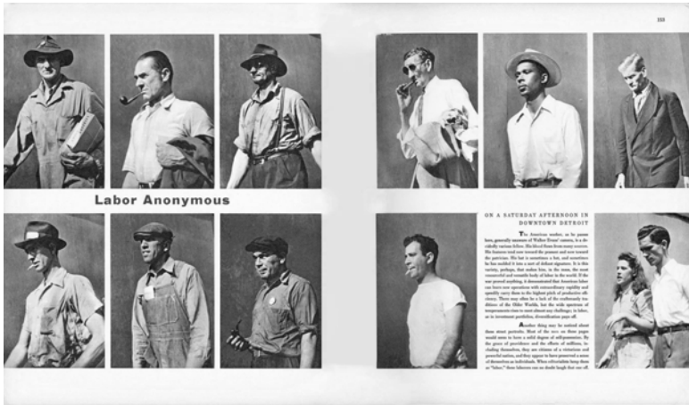
Abbildung 25: Walker Evans: Labour Anonymous. Quelle: Fortune 1946.

Ganzen evoziert, die »aboutness« eigentlich definiert. Die sichtbar hervortretende Heterogenität lässt das anonyme Kollektiv der amerikanischen Arbeiterschaft erst als ein wahrnehmbar Ganzes hervortreten. Mit anderen Worten gesagt, liegt hier eine komplexe Operation vor, die weder ausschließlich diskursiv noch visuell genannt werden kann. Die Fotografie als Evidenz verbindet sich mit dem Text zu einer Aussage im umfassenderen Sinne, die Anonymität mit dem Schlüsselterm der Arbeit verbindet. Doch gleichzeitig entsteht die wahrnehmbare Vielfalt gerade dadurch,