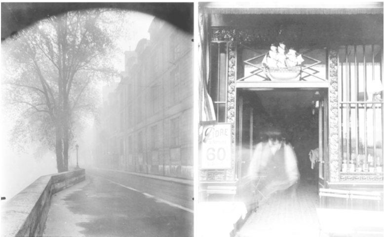
Abbildung 18: Eugène Atget: Quai d'Anjou, 1926 (links); Au Petit Dunkerque, 3 quai Conti 1900 (rechts).

entwickeln sollte, dient nicht nur der Abbildung dessen, was vor der Kamera sich unbezweifelbar befunden hat, sie dient nicht nur dem Indexalischen. 184 Sondern sie referiert indirekt darauf, was nicht da ist: die abwesende Industrialisierung und ihre negativen Folgen. Hierin lässt sich auch erkennen, weshalb Mac Orlan sich so sehr für Atget interessiert hat: Indem die Fotografie eben gerade eine Realität zum Erstarren zu bringen vermag, erzeugt sie erst das gesellschaftlich Imaginäre, le Fantastique social . Es handelt sich um einen Vorgang, der eine indexalische Theorie der Fotografie eben gerade nicht erkennen kann. Wohl gerade dadurch erhält die Wirklichkeit, die er zeigt, auch eine gewisse Affinität zum Surrealismus, zu jener Bewegung, die seine Fotografien entdeckt und sie in ihre eigenen »Visions surréalistes« aufgenommen hat. 185 Tatsächlich verweisen seine Fotografien, die einem sachlich nüchternen Blick folgen, immer auch auf eine Wirklichkeit, die nur über das Fotografische erscheint, damit die Technik gleichsam auf ihre technische Form zurückwirft und auf diese Weise auch das gewohnte Sehen surreal verfremdet. Der Mensch, der in