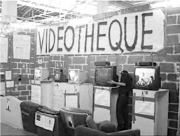
Abbildung 28: Thomas Hirschhorn: 24 heures Foucault. Palais de Tokyo, Paris, 2004.

mer rätselhafter wird, während die epistemische Figur Michel Foucaults permanent an den verschiedensten Orten erscheint: Videos, Zeitungen, Affichen, Exzerpte von Studierenden, Porträtfotografien. Insofern würde der empirische Foucault gerade durch den epischen Gebrauch seines Namens anonymisiert und nicht über dessen bewussten Versuch des Verbergens. Das könnte auch die Botschaft von Hirschhorns Ausstellung sein.