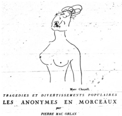
Abbildung 17: Les anonymes en morceaux.

ner Ästhetik des Anonymen zentral ist, nicht darum, Kunst zu schaffen. Er lässt seine Bilder nicht in Galerien ausstellen und publiziert in keiner Fotografie-Zeitschrift, 167 er sieht sich vielmehr als ein Archivar, der seine Bilder wiederum den Künstlern zur Verfügung stellen will. Was er intendiert, ist, Material für Künstler bereitzustellen, die dieses für ihre Zwecke gebrauchen können. Auf dem Schild, das zu seinem Atelier weist, steht »documents pour artistes«. 168 Als Man Ray seine Arbeit entdeckt und zur Kunst erklären will, soll ihm Atget geantwortet haben: »Es sind doch nur Dokumente«. 169 Ähnlich wie Hills ursprüngliche Intention des Riesengemäldes, soll für Atget die Fotografie zunächst die Evidenz liefern, die dann erst als Basis einer künstlerischen Formung dient; wie bei Hill und Adamson Praktiken verselbständigt sich die Evidenz zu einer eigenen Form des Sichtbaren. Durch seine Weise des Sehens und Fotografierens hat er nicht nur die surrealistische Bewegung wesentlich beeinflusst, sondern auch das hervorgebracht, was »dokumentarischer Stil« heißen wird: Die dokumentarischen Fotografien, im Gegensatz zur Pressefotografie oder zu Fotografien des »Muckraking«- Journalismus, dienen nicht bloß der unmittelbaren Darstellung partikularer Tatsachen, sondern sie erscheinen als Dokumente umfassender gesellschaftlicher Realität, die sich ihnen abschattiert. 170