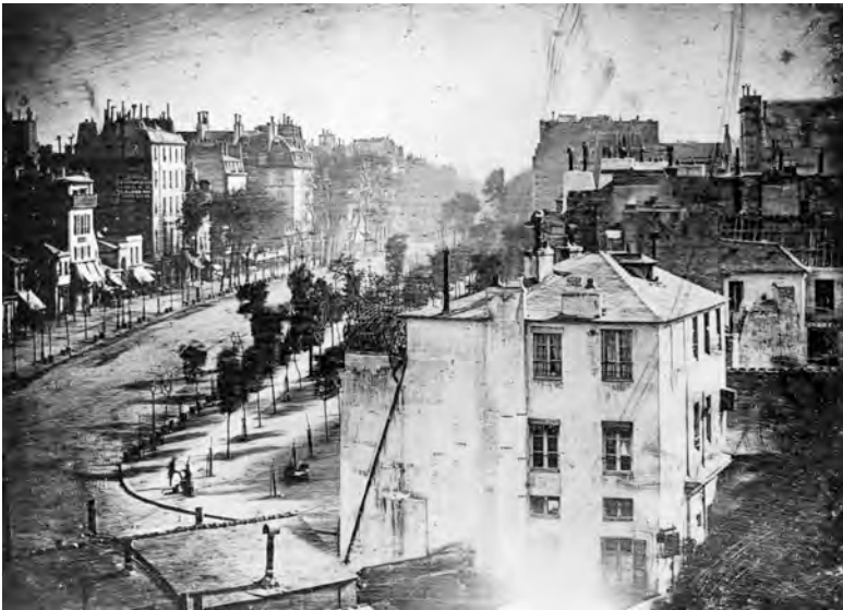
Abbildung 11: Erstes fotografisches Abbild eines Menschen? Daguerres Fotografie des Boulevard du Temple 1838.

vermag, erzeugte also ein unerwartetes Bild einer zur Tageszeit quasi menschenleeren Stadt. Doch bei einem der Bilder, und nur bei einem, 26 zeigte sich etwas Seltsames, augenscheinlich ein Mensch, aufrecht, ein Bein angehoben, vor ihm wahrscheinlich eine verwischte Gestalt; ein Mensch, so scheint es, der sich die Schuhe putzen lässt. Diese Szene führte dazu, dass