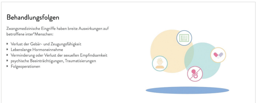
Abb. 4: Screenshot Inter* Fortbildung